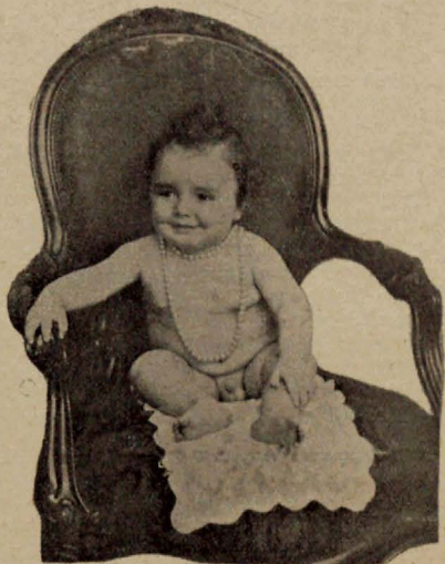
Niño a quien se refiere la nota clínica adjunta