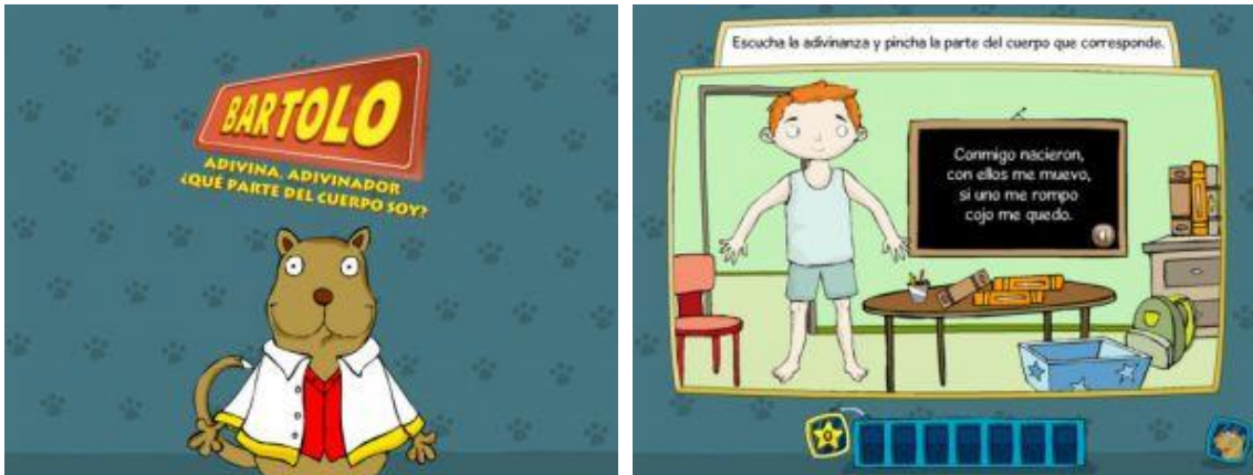
Figura 1. Bartolo: Adivina ¿Qué parte del cuerpo soy?

En la concreción espacio temporal, las actividades se empezaron a realizar en el aula con indicación de que los niños continuaran con la Unidad Didáctica en sus domicilios y con sus dispositivos móviles o los de sus padres. Así, las tareas eran realizadas, además de con los recursos tradicionales tales como los lápices de colores, con los Tablets y Smartphone aportados por el centro educativo y por el alumnado, según tuviera o no algún dispositivo compatible con la aplicación. Los padres eran un elemento impulsor de la actividad, creando el momento oportuno y la disposición de los recursos para que se pudiera llevar a cabo en el domicilio, pero sin entrar a formar parte directa en la realización de las tareas. La involucración de las familias en esta Unidad contribuye a abrir el aula a la formación de sus hijos y a incorporar recursos innovadores, por otro lado de uso común en los hogares. Las agrupaciones de las actividades fueron en pequeño grupo o por parejas, con el fin de todos los alumnos pudiera practicar con la aplicación.