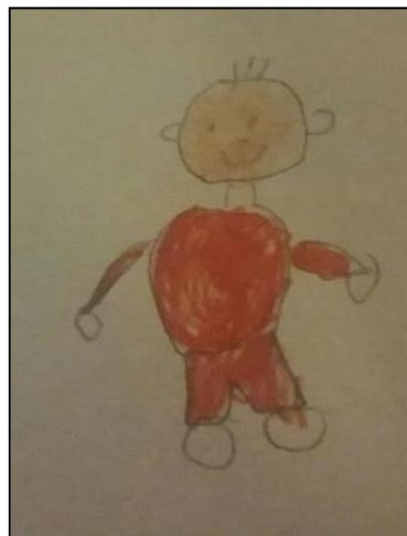
Figura 3. Alumno 2: Dibujo de una imagen de mí mismo.