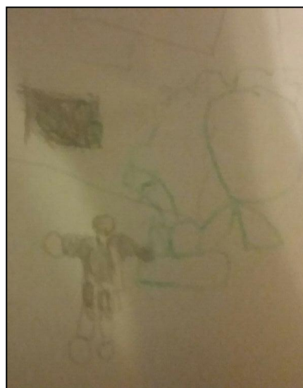
Figura 4. Alumno 3: Dibujo de una imagen de mí mismo.

En los primeros dibujos de las figuras 2, 3 y 4, comprobamos en la Observación de la Imagen en su Conjunto, que los alumnos no dominan las proporciones, realizan dibujos que ocupan completamente la hoja completa, dando especial importancia a unas partes del cuerpo respecto a otras.