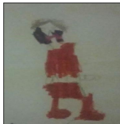
Figura 2. Alumno 1: Dibujo de una imagen de mí mismo.