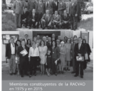
Memoria conmemorativa de la RACV en 1975 en 2015