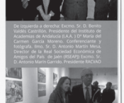
Acto de clausura del curso académico 2014-2015