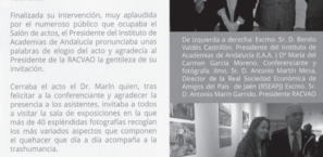
Exposición y conferencia en Jaén

El pasado 28 de diciembre la Sala de Exposiciones y el Salón de Actos de la Real Sociedad Económica de Amigos del País de Jaén, en cuya Junta Directiva forma parte el presidente de la Real Academia de Ciencias Veterinarias de Andalucía Oriental, hizo cesar de estas instalaciones para celebrar una conferencia y exposición fotográfica sobre "La Trasmurcancia en la provincia de Jaén" organizada por esta Corporación con el propósito de adherirse al calendario de actividades que organiza el Ayuntamiento de Jaén a través del Departamento de Educación, Cultura y Deportes para el desarrollo de la programación del Patrimonio Cultural Inmaterial.