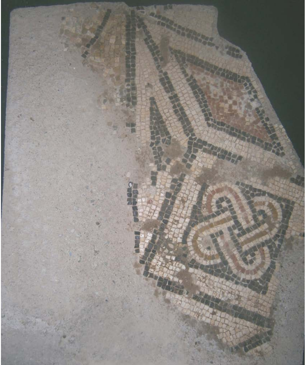
Imag. 3. N.R. 26702.