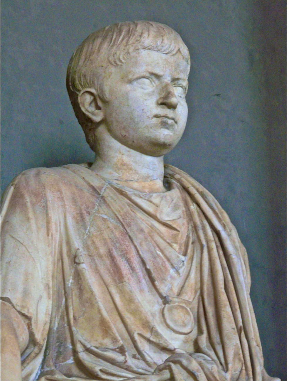
Imag. 6. Estatua de niño con bulla.