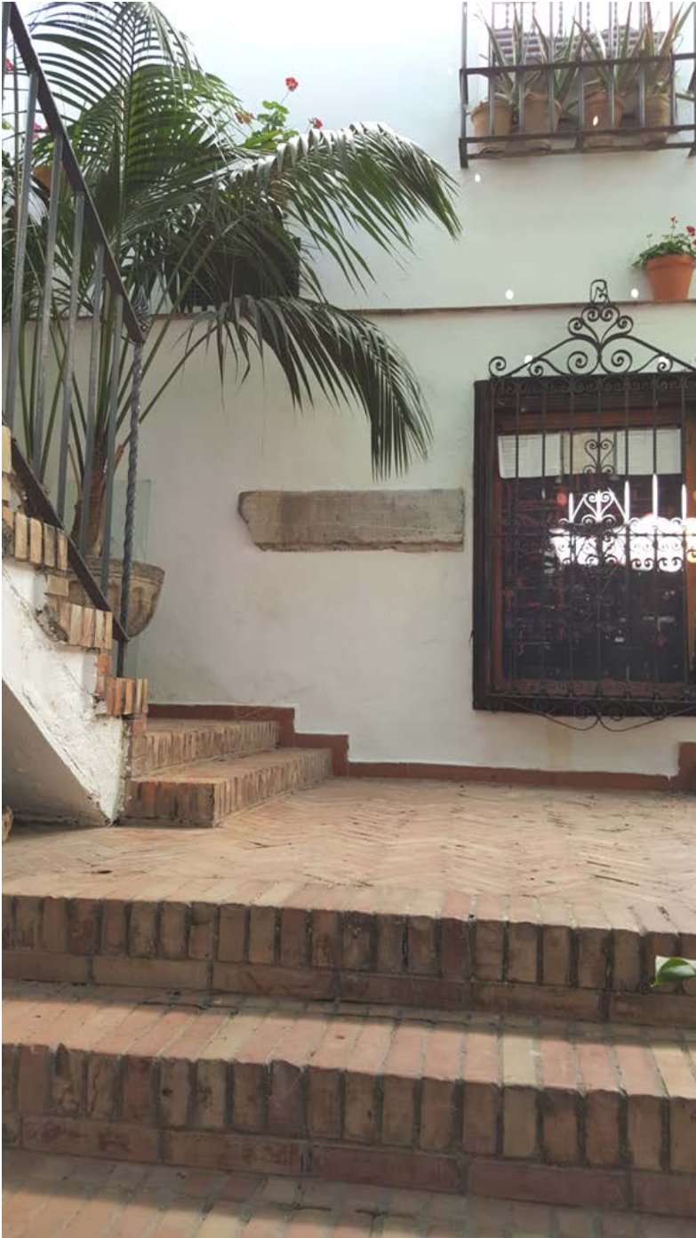
Imag. 1. Situación del epígrafe.