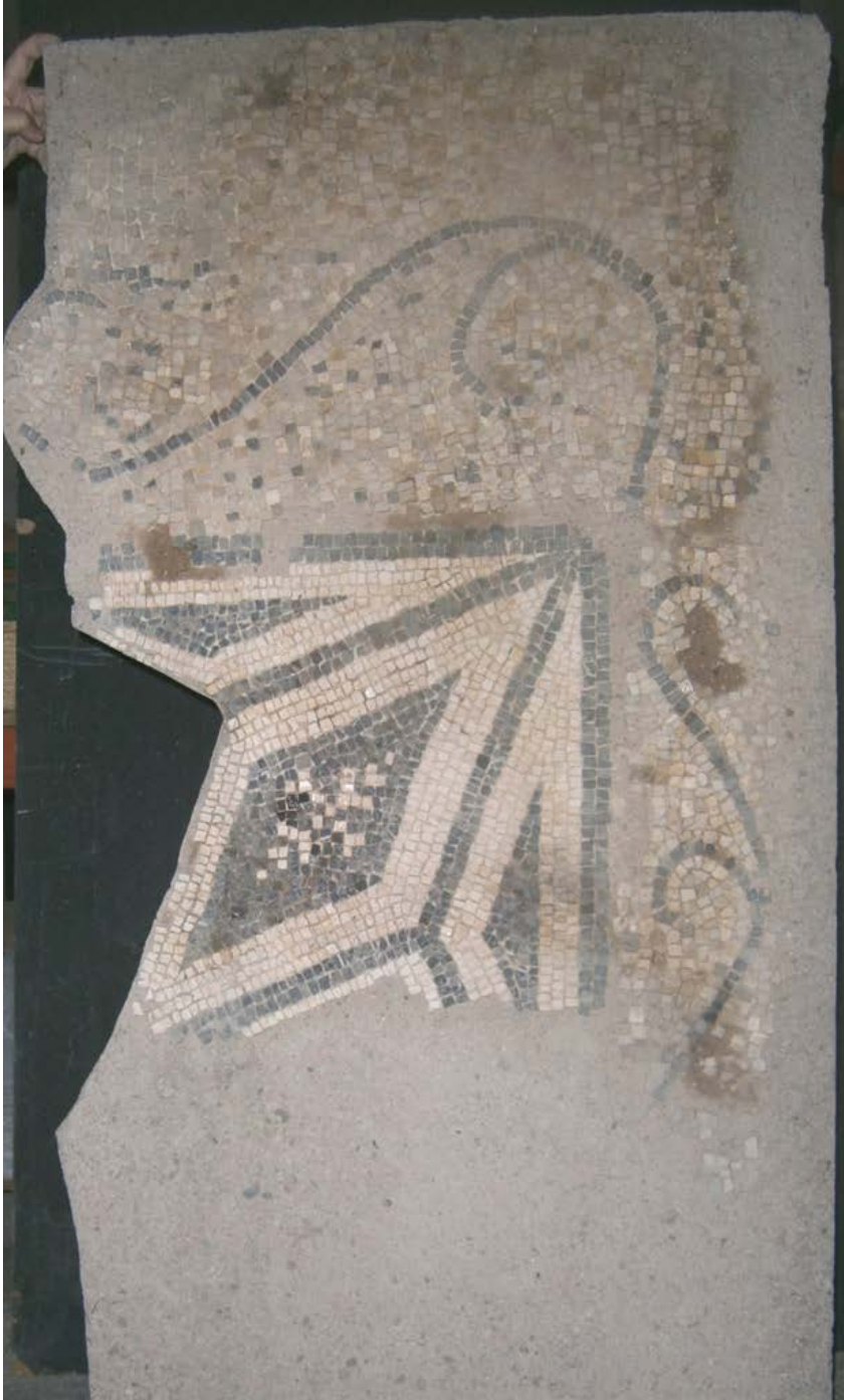
Imag. 2. N.R. 26702.