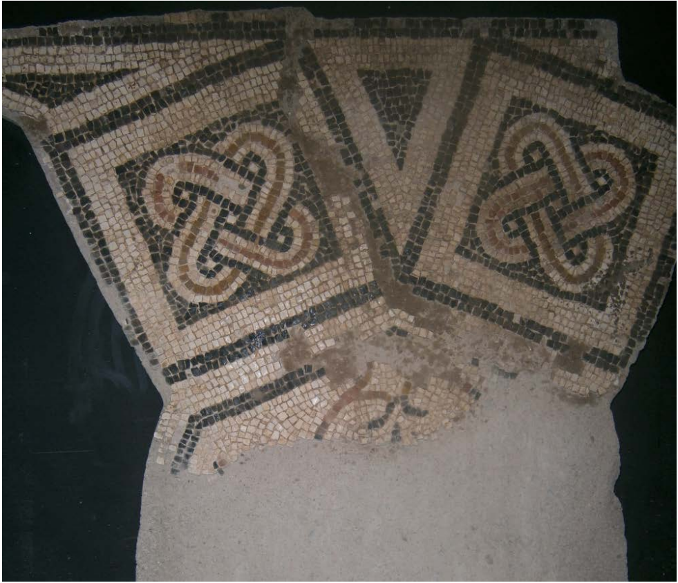
Imag. 4. Foto Museo Arqueológico. N.R. 26702.