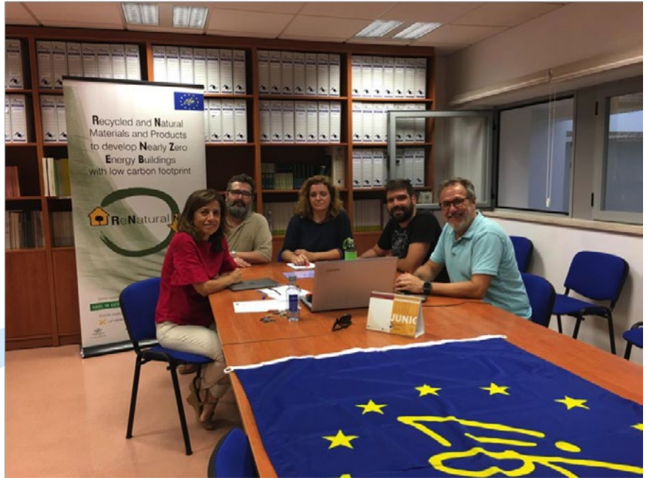
Reunión de trabajo de los integrantes del equipo.

Por otra parte UCO ha desarrollado distintos sistemas constructivos en base madera alternativos a los tradicionales para distintas tipologías de cubiertas, forjados, fachadas y particiones interiores, incorporando criterios técnicos, económicos y ambientales que contribuyen a los objetivos de consumo energético casi nulo y baja huella de carbono.