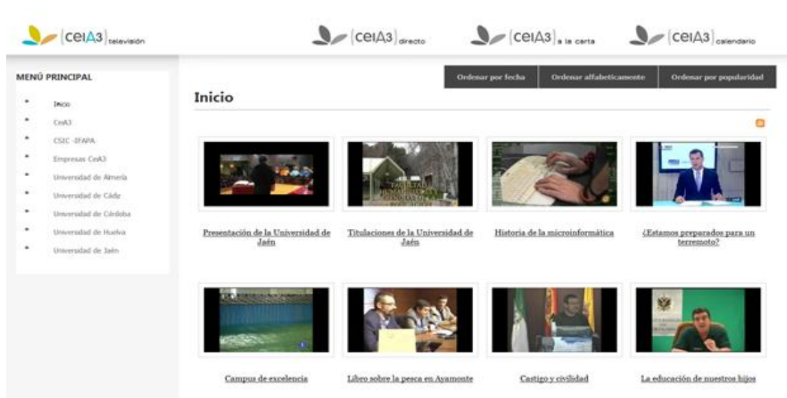
Imagen 3: Página WEB del ceiA3