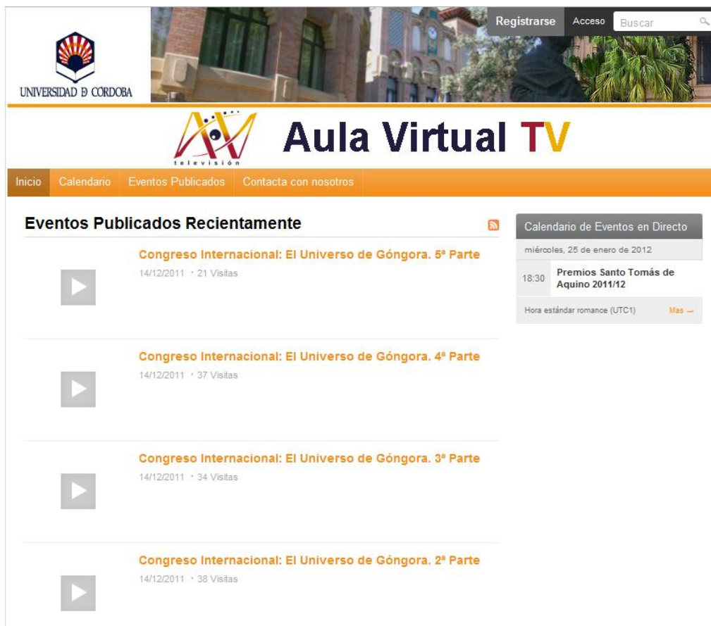
Imagen 2: Página WEB del Aula Virtual TV

En relación con lo anterior, mostramos el portal de Web TV (imagen nº 2) de la Universidad de Córdoba, cuya dirección web es la siguiente: http://aulavirtualtv.uco.es