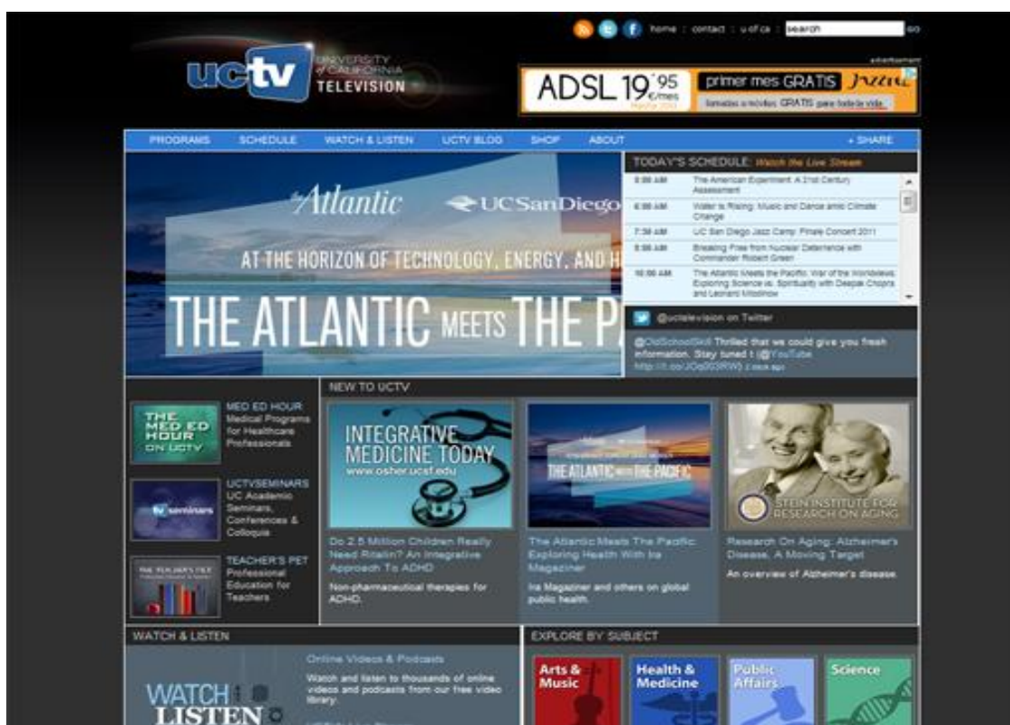
Imagen 1: Página WEB de la UCTV.

Es ya un clásico hablar de la televisión por Internet en universidades tales como la de California ( http://www.uctv.tv/ ), creada en el año 2000, que representa un modelo a imitar, pues actualmente posee una audiencia millonaria, similar a la de cualquier televisión convencional.