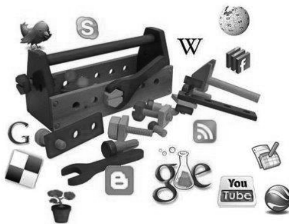
Imagen 2. Herramientas web 2.0 y 3.0.

las tecnologías de inteligencia artificial, la web semántica, la Web Geoespacial o la Web 3D.