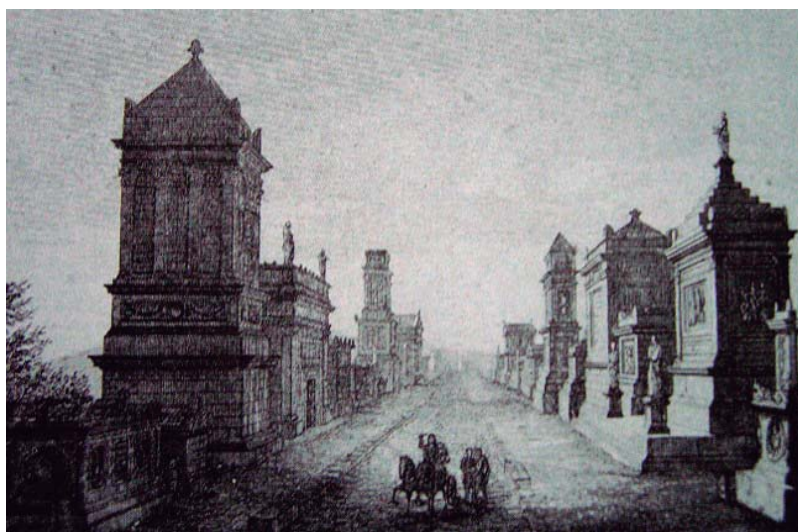
Fig. 1. Recreación ideal de la Vía Appia, según Canina

Desde entonces, la labor a seguir ha sido la de abordar una síntesis que nos permitiera reflexionar sobre los problemas arqueológicos más importantes que afectan al tema de estudio, en aras de establecer una primera tipología, no dogmática, de las tumbas conocidas, y fijar sus características formales, áreas de expansión, evolución cronológica y modelos, así como su imbricación en