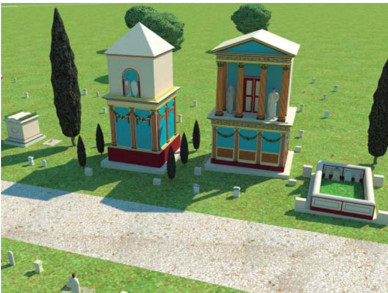
Fig. 3. Recreación 3D del conjunto funerario de la calle Muñices. Autor. José M a Tamajón

cordubense entraría, pues, dentro de las líneas definidas por la propia Roma, cuya voluntad fue la de transmitir determinados modelos, utilizando para ello las capitales provinciales, desde donde se transmitirían a entidades urbanas de menor rango.