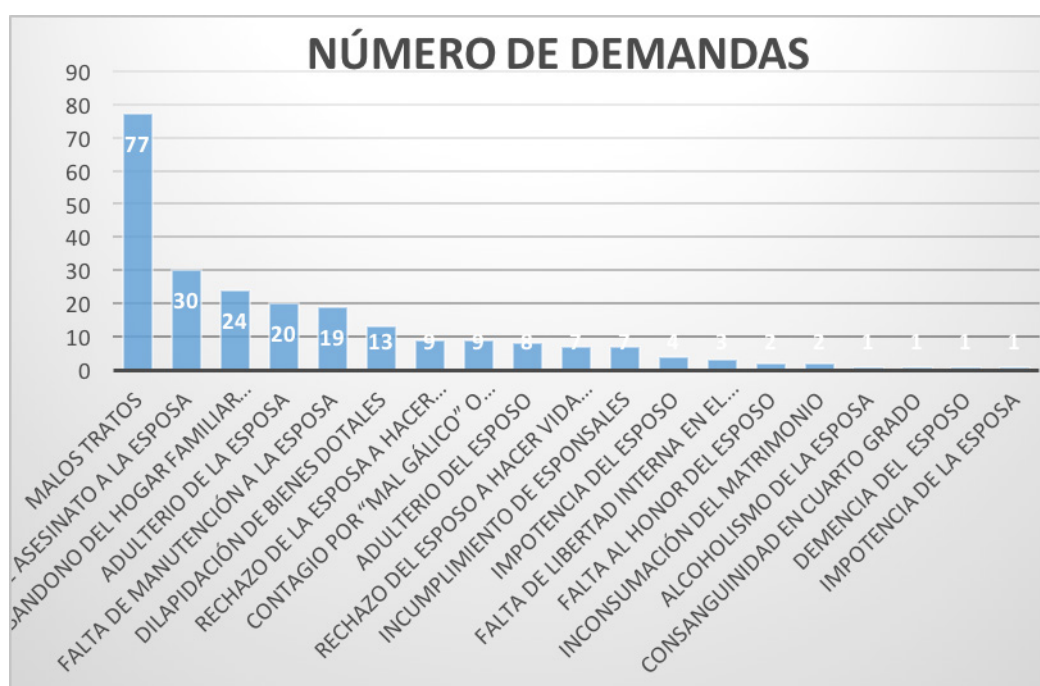
Gráfico 3: Número de demandas según la tesis del enunciado de la presentación

b) Las cifras arrojan los siguientes datos: la mayor parte de denuncias obedecen a los malos tratos padecidos por la esposa (77). Le siguen en número el intento de asesinato a la misma (30), el abandono del hogar familiar por parte del esposo (24), el adulterio de la esposa (20), la falta de manutención a la esposa y familia (19) y la dilapidación de los bienes dotales (13). Es abrumador comprobar el gran número de denuncias que aportan información sobre el terrible papel que padecía la esposa en el ámbito familiar, como se puede apreciar en el siguiente gráfico: