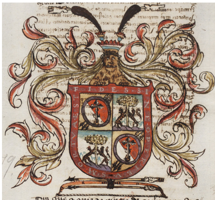
Fig. 15: Escudo de Coyoacán (ADA-C 238-2-16)

Distintos objetos de fabricación nativa se convirtieron en muebles plenamente heráldicos en la composición de las armerías de los conquistadores y, sobre todo, de los caciques que habían colaborado con ellos 60 . Entre aquellos se contaban las rodela ceremoniales sobre las que se representaron figuras o glifos, esto es, tratándolas al estilo de los escudos de armas. Sólo en el caso de Coyoacán se introdujeron en las armerías municipales, mediante “tres saetas a manera de las que traen los indios” y una rodela blanca y roja cargada de la cruz de los frailes dominicos que evangelizaron la región “que salga por la boca de una cabeza de raposa”, aunque, en realidad, se trataba del coyote alusivo al glifo prehispánico de esta población tepaneca cuyo nombre náhuatl significa “lugar de coyotes” (Figura 15) 61 .