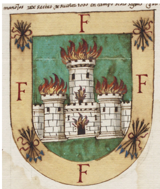
Fig. 4: Escudo de La Serena (ADA-C 238-1-133)

Del mismo modo que muchas villas costeras del Cantábrico seguían exhibiendo en sus armerías las embarcaciones anteriormente grabadas en sus sellos medievales, también se trató de resaltar el emplazamiento portuario de algunas poblaciones americanas mediante su figuración escenográfica, en especial las establecidas a ambos lados del istmo de Tierra Firme. Así, en el escudo de Panamá aparecían “dos carabelas por señal que esperamos en nro señor que por allí se ha de hacer el descubrimiento de la espeçería y encima dellas una estrella en señal del polo antártico”, aludiendo a la ansiada conexión entre las Indias Orientales y Occidentales a través de esta fundación en el litoral del Pacífico; mientras que el de Nombre de Dios, el primer apostadero de la flota de Indias en la costa atlántica, presentaba “un puerto