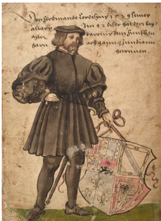
Fig. 1: Hernán Cortés (Cristoph Weiditz, Trachtenbuch , 1529)

su segunda mujer Juana de Zúñiga y Ramírez de Arellano, respectivamente, y 4) el concedido por Carlos V en 1525, asimismo cuartelado (Figura 1) 29 .