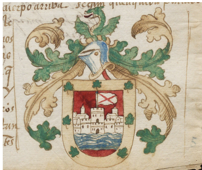
Fig. 2: Escudo de Valdivia (ADA-C 238-1-137)