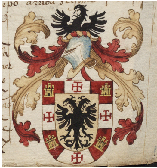
Fig. 13: Escudo de La Imperial (ADA-C 238-1-52)

Real de Granada. Aunque no cabe asociar la divisa en cuestión con el mueble parlante del Nuevo Reino, parece que su diseño gráfico perduró en esta heráldica más tardía 49 .