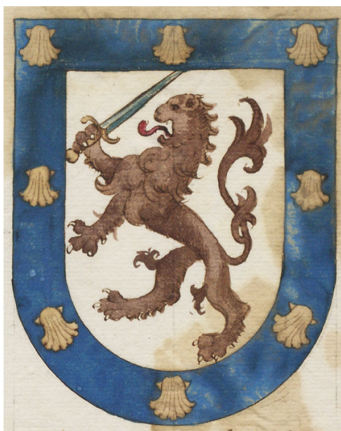
Fig. 10: Escudo de Santiago de Chile (ADA-C 238-1-130)

Los escudos que no mostraban ciudades, paisajes o imágenes religiosas sólo abarcan la quinta parte de los analizados y, en su mayoría, ostentaban leones 42 . Cinco exhibían simplemente uno, bien coronado (Segura de la Frontera), empuñando una espada (Santiago de Chile, Figura 10), empinado a un árbol (Santa Fe de Antioquía y Villarrica), o el parlante que mantenía una venera cargada de la cruz de Santiago (Santiago de León de Caracas). Dos leones enfrentados sosteniendo una cruz componían las armas de Cartagena de Indias y otros tantos erguidos a un pino las de Guadalajara, mientras que en las de San Juan de Pasto figuraban cuatro enmarcando un castillo (Figura 11).