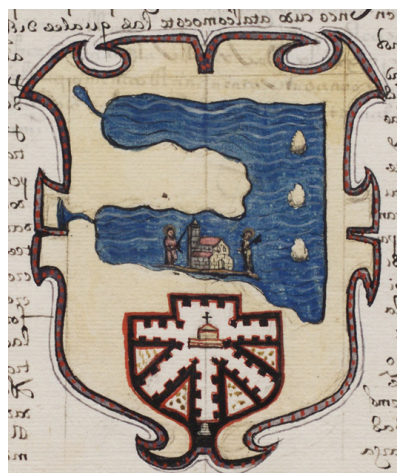
Fig. 7: Escudo de Michoacán (ADA-C 238-2-41)

Completa este apartado un curiosísimo mueble dibujado en la mitad inferior de las armas de Michoacán que debió interesar especialmente a sus solicitantes aunque no se aludió a él en el texto de la concesión, quizás porque el amanuense fue incapaz de atribuirle un significado (Figura 7). Se trata de la extraordinaria planta de la catedral de Pátzcuaro, cuyo proyecto rompía decididamente con la tipología tradicional al estar dotado de cinco naves dispuestas radialmente para confluir en el testero. Este novedoso modelo facilitaría la visibilidad del altar mayor desde todos los puntos del edificio a los numerosos indios tarascos cristianizados durante el pontificado del obispo Vasco de Quiroga, cuyos afanes misioneros, entre ellos el encargo del diseño del antedicho templo, se inspiraron en el pensamiento utópico de Tomás Moro. Sin embargo, sólo una de las naves llegó a edificarse y, a la muerte del prelado (1565), los franciscanos solicitaron con éxito que cesase la obra de “aquella babilonia de la iglesia de Michoacán, pues en ella se gasta la hacienda de S. M. y la de los españoles e indios”, alegando que los últimos “no tienen necesidad de iglesias cerradas, cuanto más de iglesia que tiene cinco naves” 35 .