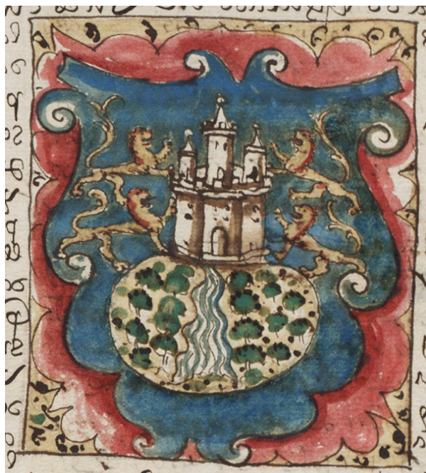
Fig. 11: Escudo de San Juan de Pasto (ADA-C 238-1-124)

Era común que la imagen del rey de los animales se utilizara como alegoría del arrojo y fortaleza de los conquistadores, tal como solía especificarse en el texto de la correspondiente cédula de concesión, pero esta cualidad se explicitó muy raramente en las descripciones de escudos municipales por lo que su presencia en estos puede obedecer a otras razones, entre ellas las meras inclinaciones estéticas. Sin embargo, pocas dudas caben con respecto a la batalladora actitud del león de Santiago de Chile, y menos aun el de México “levantado que rasga con las uñas el dho. castillo de manera que tengan los pies en la puente y los brazos en el castillo en señal de la vittoria que en ella ovieron los dhos. xpianos”. En otras ocasiones el felino personificó a los fundadores de sendas villas, como el empinado a un roble de Antioquía alusivo al mariscal Jorge de Robledo, y el “rapante puesto en salto [...] con una corona en la cabeza e con tres barras de sangre” de Cartago, idéntico al que traía en sus armas el adelantado Juan Vázquez de Coronado 43 .