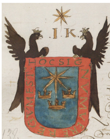
Fig. 9: Escudo de Lima (ADA-C 238-1-107)

A veces la simbolización recurrió a muebles aun más sumarios, de manera que en las armas de tres ciudades colocadas bajo la protección del patrón de España, las de Santiago de Guatemala, de Chile y del Estero, se dispusieron borduras de azur cargadas de veneras de oro en las dos primeras o bien tres veneras acompañando al castillo que aludía a la ciudad en la última. De parecida concisión era el escudo de Lima, la ciudad de los Reyes que Pizarro pretendió fundar el día de la Epifanía aunque el suceso se retrasó hasta el 18 de enero de 1535 (Figura 9). En él se exhibían “tres coronas de reyes, puestas en triángulo, y encima dellas una estrella de oro”. Así se resumieron los tres Reyes Magos y el cometa que les condujo hasta Belén, mediante una simplificación semejante a la utilizada en la cabeza de gules cargada de tres coronas de oro de las armerías de la ciudad alemana de Colonia, en cuya catedral se veneran las reliquias de los Magos. Por último, hacían referencia a las órdenes mendicantes la “cruz de las armas de Santo Domingo que está a manera de flores de lis, color de plata y negro” de Coyoacán y el cordón franciscano que enmarcaba las de San Francisco de Quito.