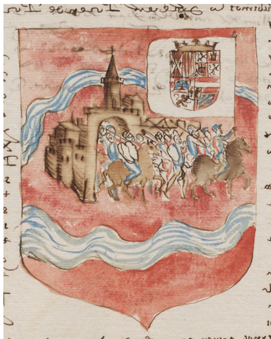
Fig. 3: Escudo de Loja (ADA-C 238-1-61)