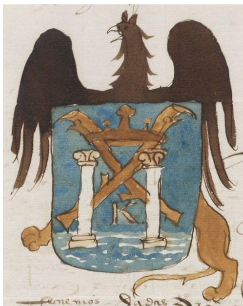
Fig. 12: Escudo de Trujillo (ADA-C 238-1-136)

de 1517). Las divisas regias también se labraron en numerosas emisiones de moneda cuya circulación contribuyó considerablemente a la divulgación de esos símbolos, la de la Banda desde 1430, en las de Juan II y sus hijos Enrique IV y Alfonso, el yugo y las flechas en las de los Reyes Católicos desde 1497, y las columnas del Plus Ultra a partir de 1537 47 .