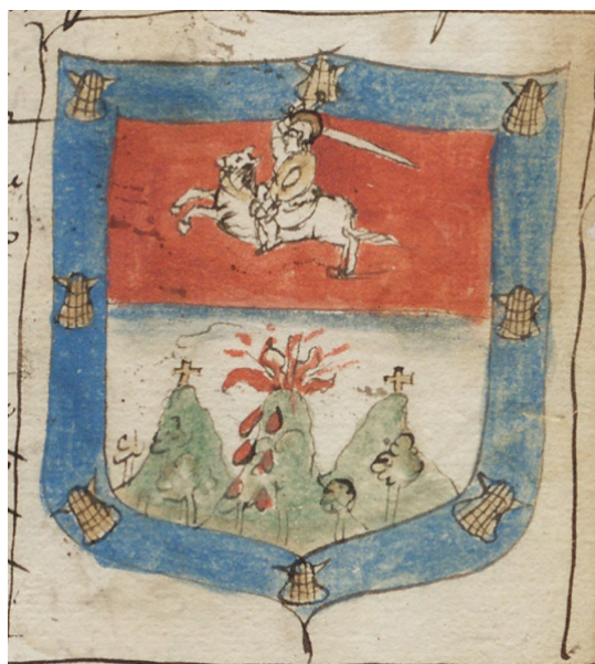
Fig. 6: Escudo de Santiago de Guatemala (ADA-C 238-1-46)

Completa este apartado un curiosísimo mueble dibujado en la mitad inferior de las armas de Michoacán que debió interesar especialmente a sus solicitantes aunque no se aludió a él en el texto de la concesión, quizás porque el amanuense fue incapaz de atribuirle un significado (Figura 7). Se trata de la extraordinaria planta de la catedral de Pátzcuaro, cuyo proyecto rompía decididamente con la tipología tradicional al estar dotado de cinco naves dispuestas radialmente para confluir en el testero. Este novedoso modelo facilitaría la visibilidad del altar mayor desde todos los puntos del edificio a los numerosos indios tarascos cristianizados durante el pontificado del obispo Vasco de Quiroga, cuyos afanes misioneros, entre ellos el encargo del diseño del antedicho templo, se inspiraron en el pensamiento utópico de Tomás Moro. Sin embargo, sólo una de las naves llegó a edificarse y, a la muerte del prelado (1565), los franciscanos solicitaron con éxito que cesase la obra de “aquella babilonia de la iglesia de Michoacán, pues en ella se gasta la hacienda de S. M. y la de los españoles e indios”, alegando que los últimos “no tienen necesidad de iglesias cerradas, cuanto más de iglesia que tiene cinco naves” 35 .