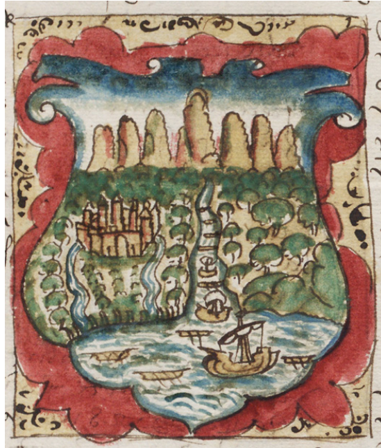
Fig. 5: Escudo de Santiago de Cali (ADA-C 238-1-129)

de mar en que haya una nao sobre unas aguas azules surta al puerto y cogidas sus velas y echadas sus áncoras con una bandera encima de la gavia de la dha. nao”. Con el exceso propio de las composiciones tardías, las armas de Santiago de Cali ostentaban “un puerto de mar con una nao, surta a la boca de un río, que sale del dicho mogote y entra en la mar, y otras naos el dicho río arriba, con unas canoas con sus remos en unas aguas azules y blancas”, a lo que se añadía un bosquejo de la compleja orografía del lugar expuesto en el párrafo siguiente (Figura 5).