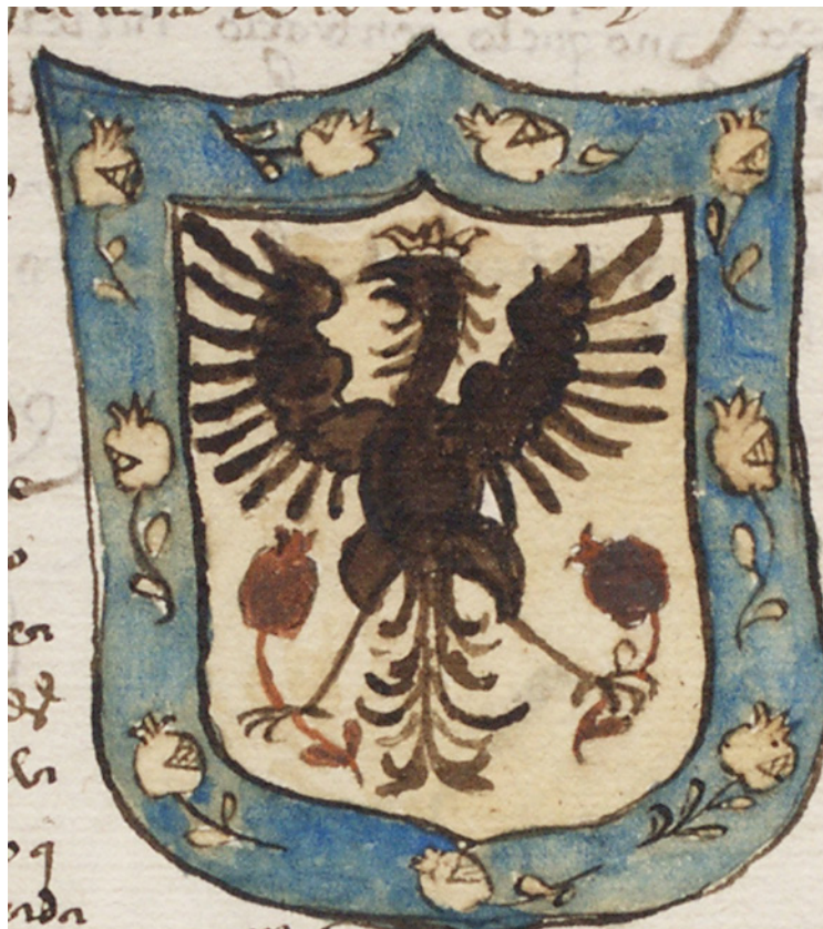
Fig. 14: Escudo del Nuevo Reino de Granada (ADA-C 238-1-44)