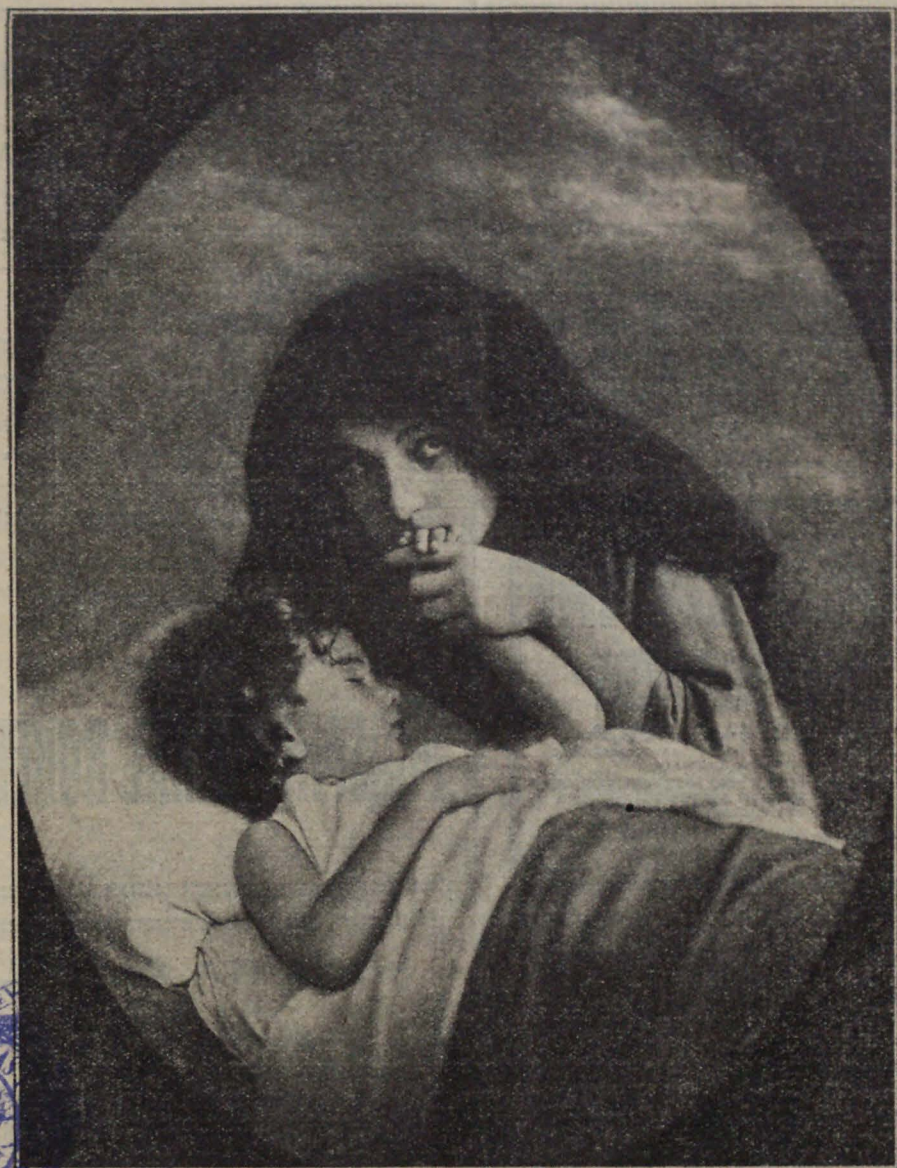
EL HIJO ENFERMO