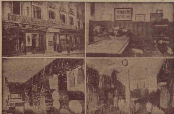
Cuatro vistas parciales de la Casa Matriz en Granada calle de Reyes Católicos

Americanas Sport - Pantalones Tennis - Gabardinas Trajes de confeccion esmeradísima Precios Fijos y económicos, como ninguna otra casa Ventas al contado :-: Siempre nuevos modelos