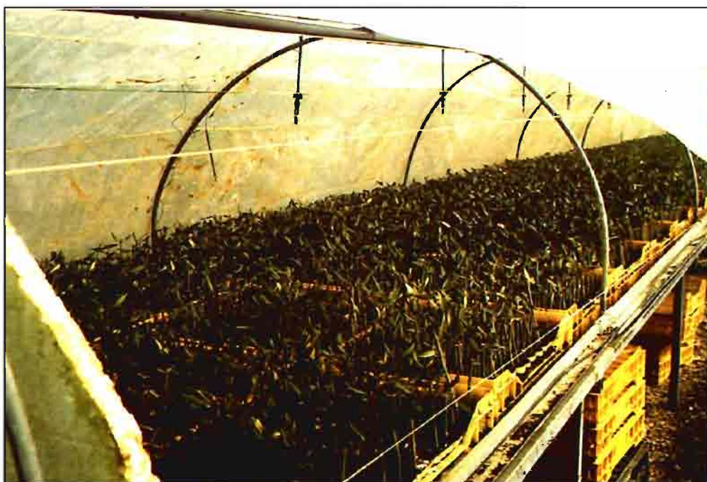
Actualmente se están desarrollando programas de mejora de variedades del olivo

zan la categoría de variedad principal. El cuadro I recoge el destino, la superficie cultivada y las provincias donde se cultivan las principales variedades de olivo de