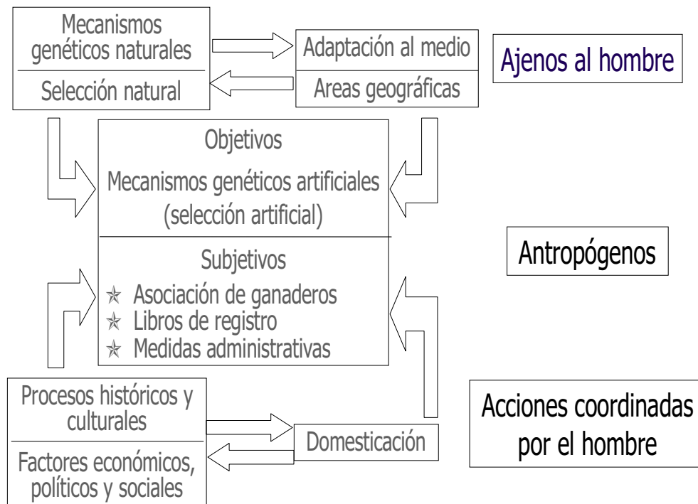
Figura 2. Mecanismos que tienen alguna influencia en la formación de las razas. (Mechanisms that have an influence on the formation of breeds).

Aunque no se pueda determinar la variabilidad de partida para la constitución de las razas y todos detalles del proceso de selección natural en la formación de las mismas (el cómo y el porqué), en los caracteres de las razas actuales se pueden observar algunos que responden a esas adaptaciones