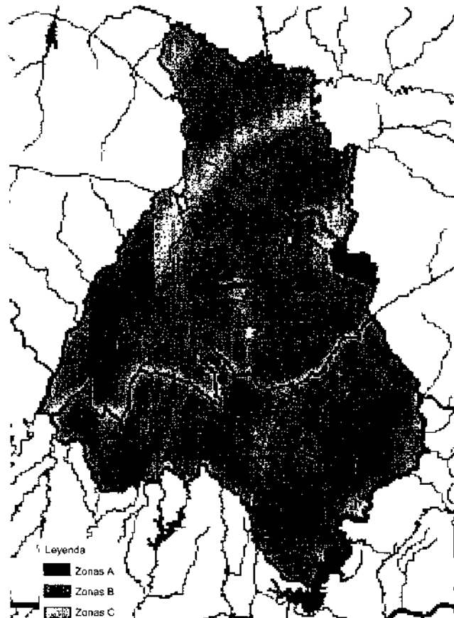
Figura 3. Zonificación del Parque Natural de la Sierra de Cardeña y Montoro según el PORN de 1994. Fuente: www.juntadeandalucia.es/medioambiente Elaboración prop.a.

Tanto el PORN como el PRUG mostraban, a nivel de contenidos, un excesivo carácter regulador o normativo, resultando por el contrario inexistente cualquier tipo de propuesta de actuación a emprender en este espacio protegido 10 .