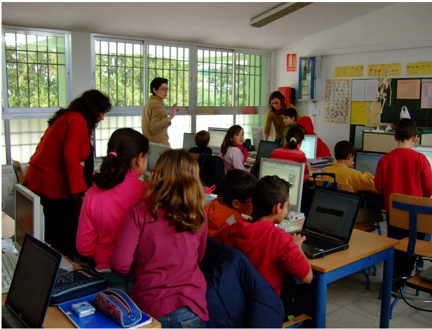
II. 1 Sesión de trabajo de madres, voluntarios y maestra con alumnado de 3º de primaria.

En las experiencias educativas que se desarrollan siguiendo modelos como los anteriormente mencionados las interacciones entre los y las participantes adquieren una importancia capital. Para favorecerlas es necesario crear agrupamientos de niños y niñas basados en la diversidad, con diferentes habilidades tecnológicas, para que puedan resolver de forma cooperativa las tareas diseñadas. Cada uno de estos grupos es tutorizado por un adulto que puede ser un padre o madre, un universitario voluntario o voluntaria, o su profesora. Los adultos, además de resolver las posibles dificultades que se presentan, tienen especial cuidado en favorecer un diálogo igualitario, motivando y mediando con los componentes del equipo para que la tarea se resuelva con éxito.