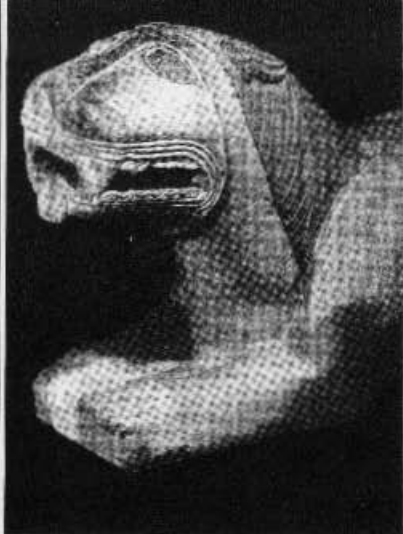
Leona ibérica, de Nueva Carteya.

El Museo Arqueológico de Córdoba se ha instalado en el Palacio de los Páez, edificio del siglo XVI del que quedan algunos elementos, como la fachada, atribuida a Hernán Ruiz, la escalera noble y algún artesonado. Las colecciones presentadas ofrecen una documentación de primer orden, en ocasiones única, sobre ciertos aspectos de las culturas regionales prehistóricas, ibérica, romana, visigoda e hispano-musulmana. Se ha procurado que el orden de exposición sea cronológico, con sucintas explicaciones en cada una de las salas, al objeto de orientar al visitante. La estructura arquitectónica de la casa, más la serie de fuentes y ornamentación vegetal, prestan al conjunto un atractivo ambiente típicamente cordobés.