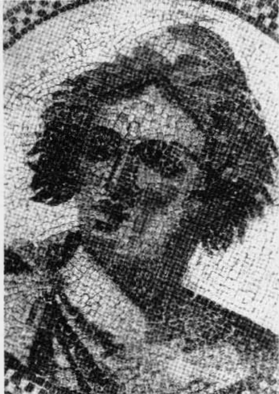
Detalle de un mosaico romano.

Patio II. — Entre la serie de estatuas, cabezas, mosaicos, etc., destaca el Mithras, la Minerva, de tradición helenística, y un sarcófago romano-cristiano del siglo IV.