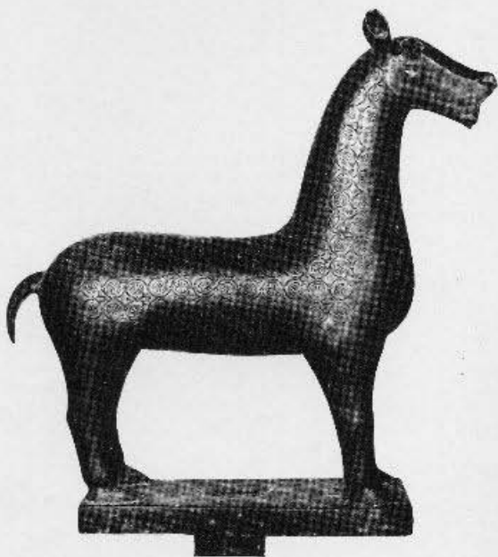
Cervatillo de Medina-az-Zahra.