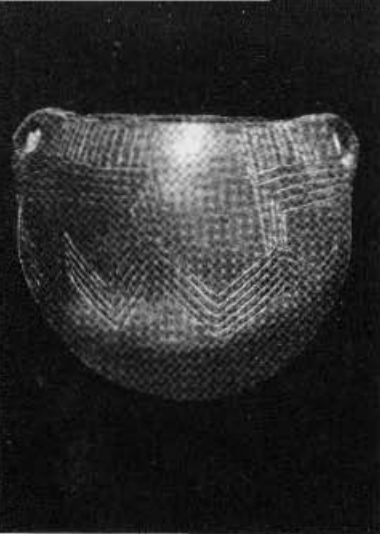
Vaso de la Cueva de los Murciélagos, de Zuheros (Neolítico avanzado).