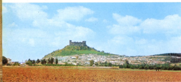
Almodóvar del Río

La Mezquita, obra única en su género, es la representación por excelencia del arte califal. Empezó a construirse a media-