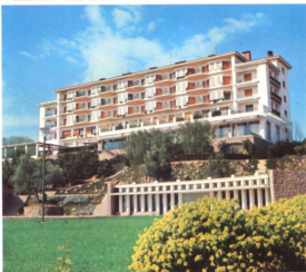
Parador de la Arruzafa. Córdoba.

Igualmente han de destacarse los palacios del Marqués de Viana, con sus magníficas colecciones y patios, de los Mar-