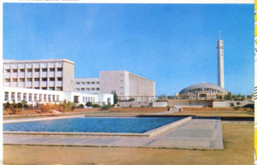
Universidad Liberal. Córdoba

Los monumentos cordobeses son de dos tipos: artísticos y populares. La sencilla calle blanca y la secreta plaza son, en otro plano, tan interesantes como el fastuoso Alcázar o el imponente templo. En Córdoba el arte no se agota en la Mez-