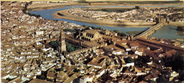
Vista aérea de Córdoba

de los más importantes de Europa. Todo ello salpicado de ruinas de palacios, castillos, monasterios y eremitorios medievales. Destacan, por su singular importancia, Medina Azzahra, San Jerónimo y las Ermitas.