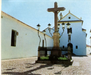
El Cristo de los Faroles. Córdoba

queses de la Fuensanta del Valle y del Carpio, Vizconde de Priego, Caballeros de Santiago, del Comendador Luna, del Indiano, de las Quemadas, de las Campanas, etc.