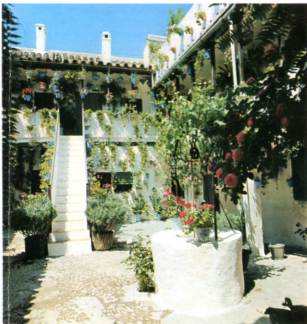
Patio típico. Córdoba

El Museo Municipal de Artesanía Cordobesa y Taurino, con el Zoco anejo, ofrece una visión de las artes menores tradicionales en la ciudad.