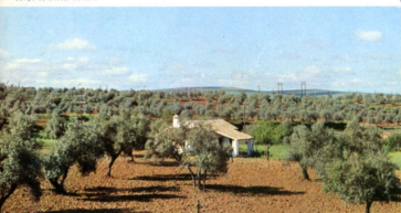
Campo de olivos. Montoro

El viejo espíritu de Córdoba satura sus callejas. Callejas de los Rincones de Oro, de las Flores, de los Arquillos, de la Luna y Junio Galión; Cuesta de Pero Mato, Calles de la Hoguera, la Muralla y la Sinagoga. Entre los rincones más representativos hay que señalar la Plaza de las Bulas, la Plaza de Jerónimo Páez, el Arco del Portillo y la Puerta de Sevilla, con el monumento a Ibn Hazm y la visión de las viejas murallas de la ciudad.