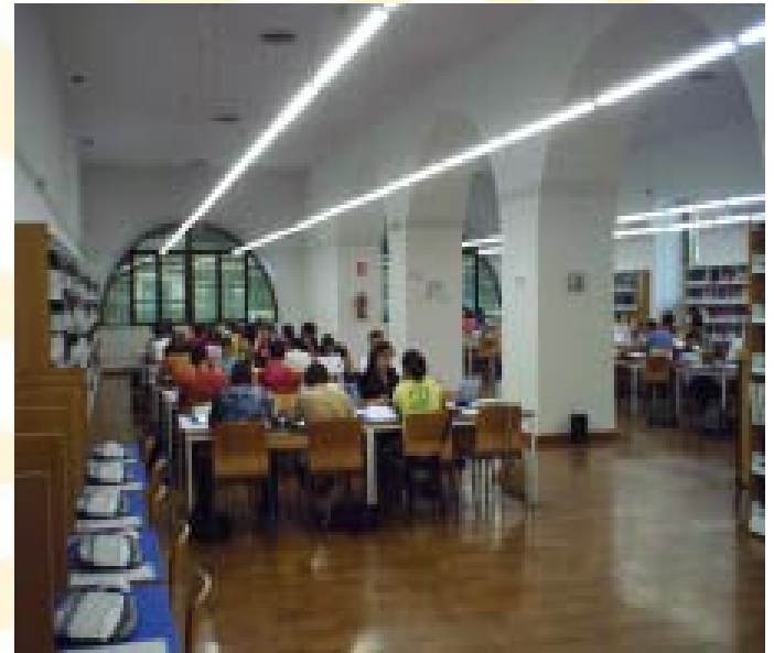
Biblioteca Universitaria de CórdobaBiblioteca Universitaria de Córdoba