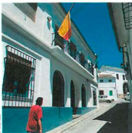
Ayuntamiento de Iznájar.