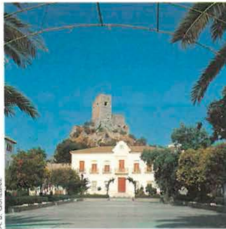
Ayuntamiento de Luque, dominado por el castillo.