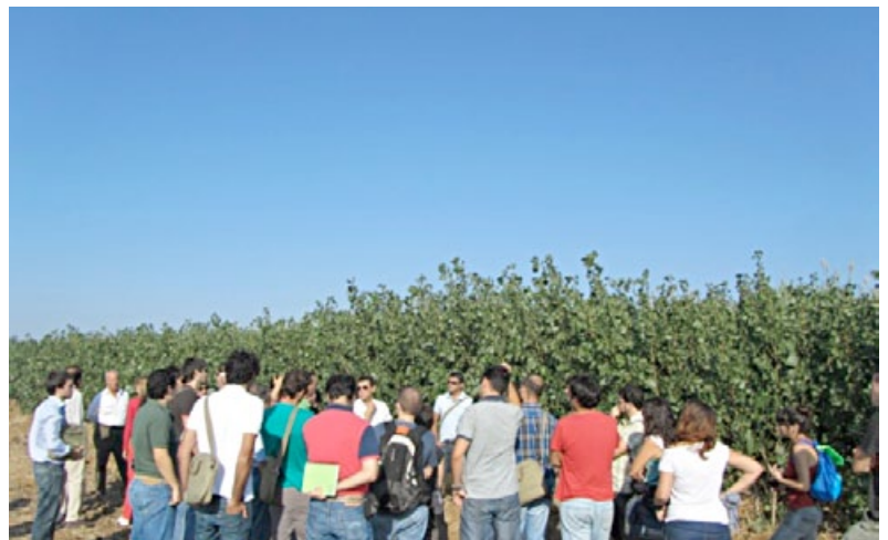
Actividad formativa a pie de campo