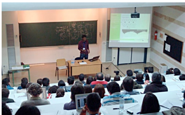
Actividad formativa en el aula