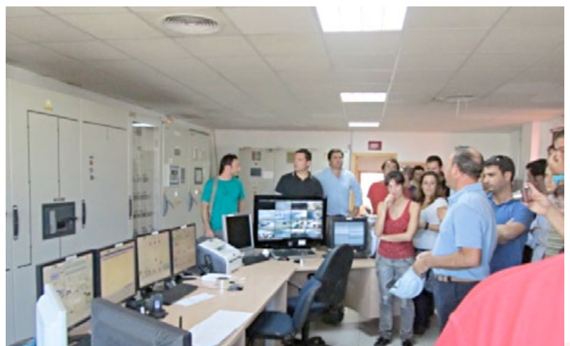
Actividad formativa en laboratorio