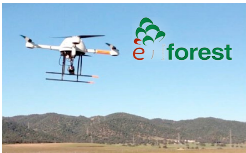
Dron en vuelo

En E-learning Forest tenemos el firme convencimiento de que una capacitación profesional basada en competencias, orientada a temas de actualidad profesional y que dote al profesional de nuevas herramientas científico-tecnológicas, son la mejor garantía para seguir avanzando dentro del ámbito profesional cada vez más competitivo e internacionalizado.