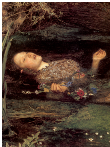
Ophelia , detalle.

En su búsqueda de lo anormal y del sadismo, para estimular tanto la imaginación como la búsqueda de nuevos valores estéticos, se impuso el tema de las jóvenes tuberculosas, suicidas, agonizantes, ahogadas, muertas 38 ... Y la doncella muerta a destiempo más celebrada por el modernismo fue Ophelia , tal como figuraba en el cuadro de John Everet Millais, tan comentado desde que fue exhibido en la Royal Academy en 1852. Hay que recordar que el pintor pasó varios días junto a un río para retratar con exactitud las flores y plantas de sus márgenes 39 , y que esta obra popularizó las flores primaverales o silvestres: la primula, la lila, la violeta,