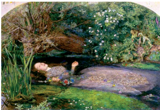
John Everet Millais, Ophelia (1851-2). Tate Gallery, Londres.

de claveles de rubí” 36 . Una corriente animista recorre el poema; el poder germinativo de las plantas viene del cuerpo que está ya en la tierra y del alma que lo preside. Verlaine queda situado al nivel de Pan, el gran Todo de los neoplatónicos, provocador de la celeste unidad a través de los ciclos de la vida y de la muerte. En esos versos expone la significación de Pan, por él se exalta la vida a través de las flores, de la primavera, de la música, del amor sobre el sepulcro del poeta, a pesar de la muerte, y más aún, por la misma muerte, que es condición esencial para el renacimiento.