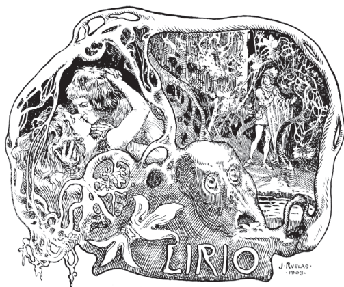
Julio Ruelas, Lirio (1903). Ilustración en Revista Moderna. Arte y ciencia , 11, año VI, primera quincena de julio, 1903.

Otras jóvenes-lirios son más perversas, y algunas también fatales. En la novela Sangre patricia (1902) de Manuel Díaz Rodríguez es Belén Montenegro quien muere joven y desde la tumba se aparece como un lirio inmenso a su amado Tulio y lo lleva a la muerte. Una inocente flor es centro de ambigüedad en “Margarita”, de Prosas profanas : Recuerda el poeta a la amada, de extraño rostro, que en la noche alegre de la primera