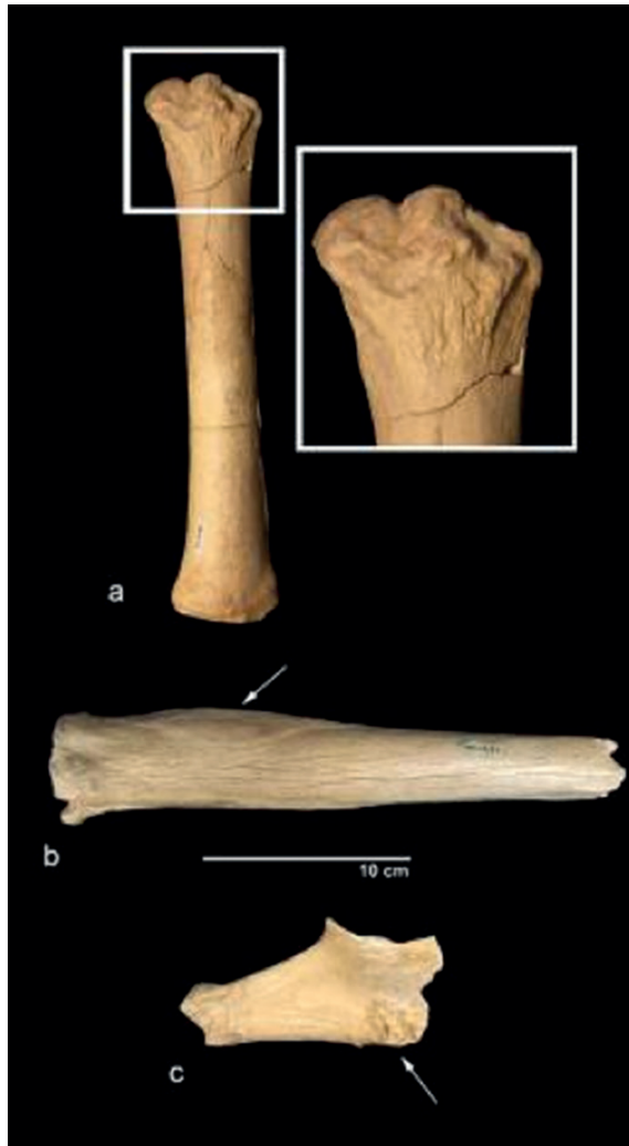
Figura 2. a: metacarpiano de E. altidens que muestra una intensa deformación en la epífisis distal. b: metatarsiano de E. altidens con un gran recrecimiento en la cara dorsal próximo a la epífisis proximal. c: fragmento de pelvis de E. altidens con abundantes osteofitos bajo el acetábulo.