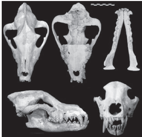
Figura 4. Cráneo y mandíbula de Lycaonlycaonoides en el que se pueden observar importantes patologías óseas (figura tomada de Palmqvist et al . 1999).

la existencia de un nivel acusado de endogamia, evidenciado por la homocigosis génica responsable de las patologías, sugiere que el tamaño efectivo de la población que habitaba en la cuenca de Guadix-Baza sería bastante reducido, lo que no sólo se debería a la baja densidad poblacional de estos hipercarnívoros, sino que posiblemente resultase también del hecho de que sólo participasen en la reproducción el macho y la hembra dominantes en cada jauría, tal y como ocurre en los licaones modernos (Palmqvist et al , 1999; Martínez-Navarro y Rook, 2003).