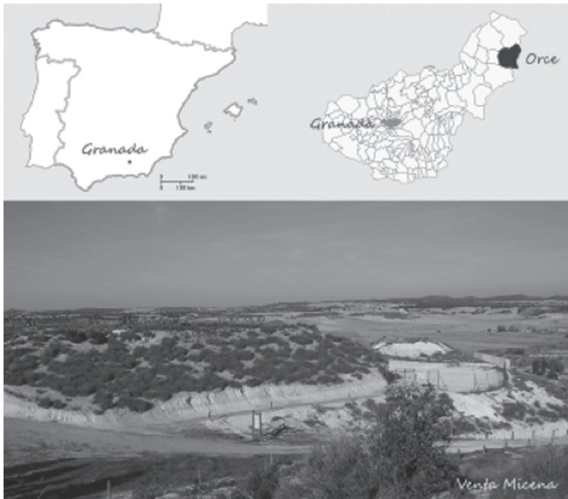
Figura 1. Localización geográfica y vista panorámica del yacimiento de Venta Micena.

Venta Micena se localiza en el borde nororiental de la Cuenca de Guadix-Baza, en la localidad de Orce, Granada, España (Fig. 1), y se ha interpretado como una acumulación ósea originada por la hiena Pachycrocuta brevirostris (Arribas y Palmqvist, 1998; Palmqvist y Arribas, 2001) en las inmediaciones de un paleolago.