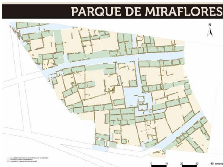
Planta del sector este del arrabal (Zona A)

Los trabajos arqueológicos llevados a cabo en la margen izquierda del río Guadalquivir han permitido sacar a la luz numerosos edificios pertenecientes al arrabal de Saqunda . Este barrio es uno de los primeros ejemplos del lento proceso de islamización de la topografía suburbana de la Córdoba que encuentran los árabes, en este caso próxima al núcleo político y religioso más importante de la ciudad, adyacente a la Puerta del Puente. Representa, por tanto, el mejor ejemplo de arrabal emiral que tenemos en Córdoba.