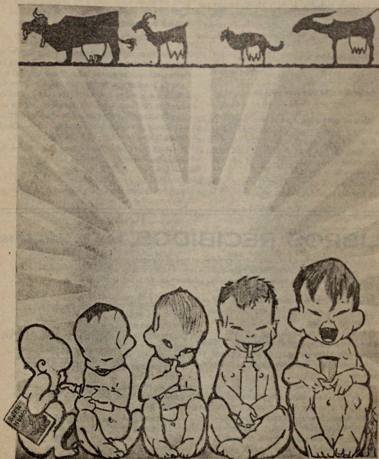
La lactancia artificial ó período hiberónico (que él dice) vista por Karikato.