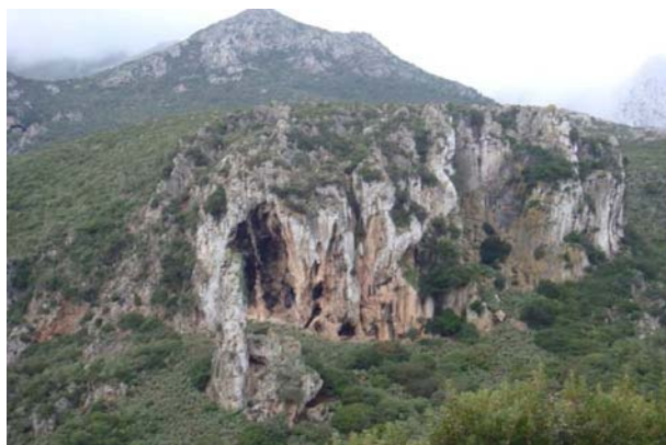
Grotte de Belyounech (Gouffre-CAP Leona)

dolomies blanches et grises et sablonneuses et des sables dorés contrastent avec les couleurs obscures de la végétation exubérante, les traces de la circulation superficielle et souterraine de l'eau à niveau les surgencias et les sources cristallines des matériaux dérivés du phénomène karstique jusqu'aux majestueuses parois verticales tant de montagne comme d'extrémités. Il convient d'apprécier la grande variété de types de ressources et à son tour la multitude de ressources qui présente le cadre de seulement 4000 Ha. Cependant, on pourrait souligner quelques types de ressources qui marquent une certaine singularité du cadre au niveau régional, national et international.