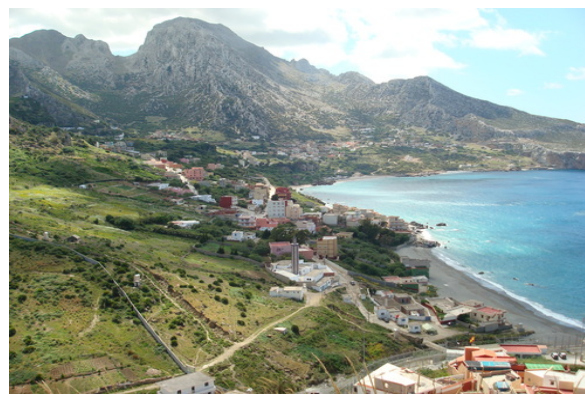
Paysage montagneux de la "Femme Morte" (Belyounech)

Le tableau suivant montre les résultats d'assignation des valeurs de fragilité/sensibilité environnementale global des types de paysages et de l'unités et les subunités environnementales définies dans le cadre territorial du SIBE de Jbel Moussa: