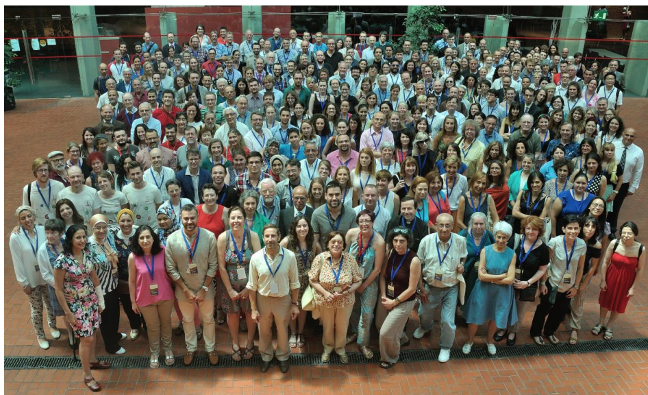
Foto de grupo

Tras la asamblea general, los participantes y asistentes que así lo solicitaron emprendieron el viaje a Tarragona (sábado), y Ampurias / Ullastret (domingo), como parte de las actividades organizadas tras el congreso.