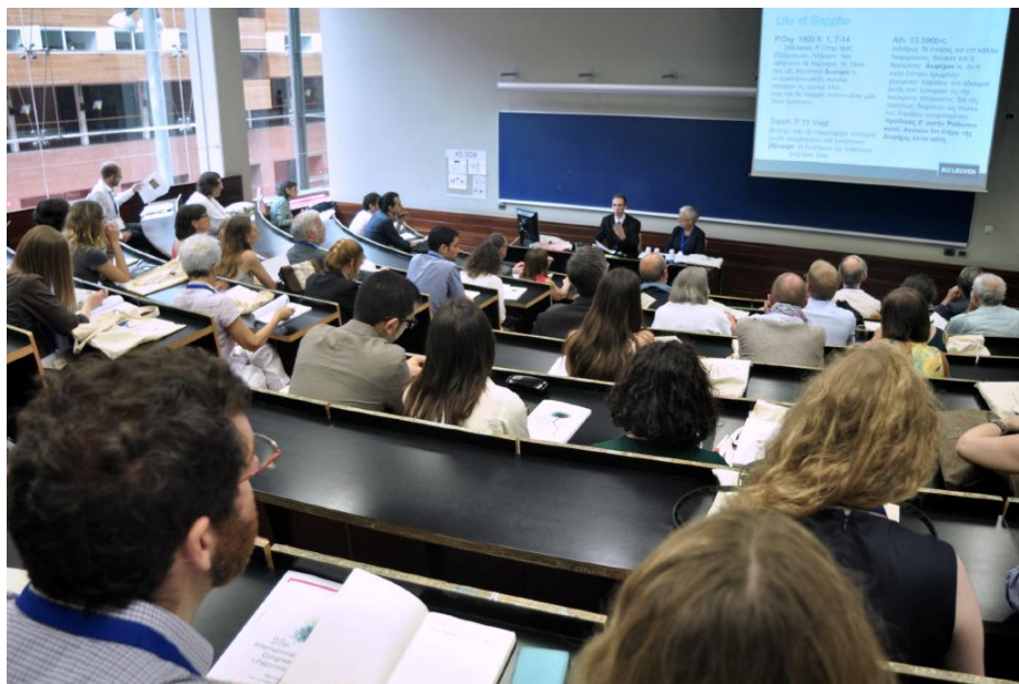
Ambiente en las salas