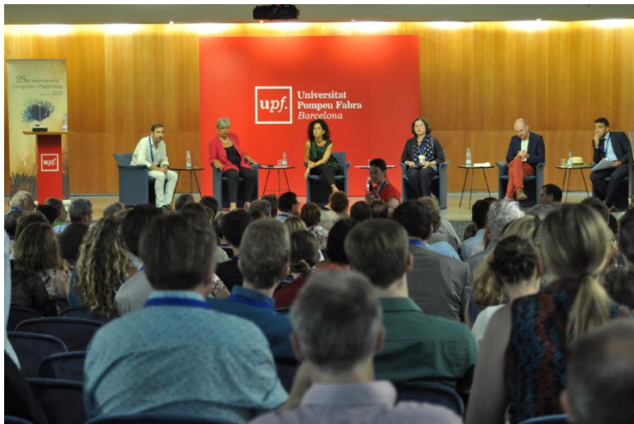
Sesión plenaria del viernes