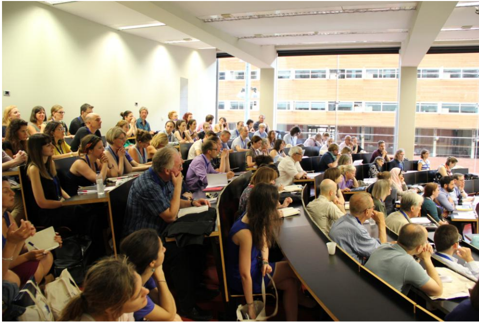
Ambiente en las salas