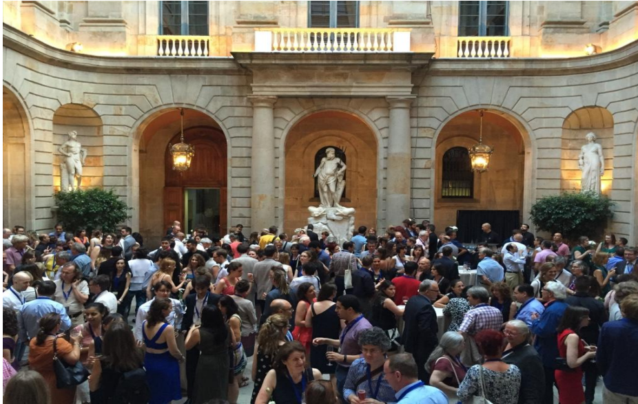
Cóctel y cena de clausura