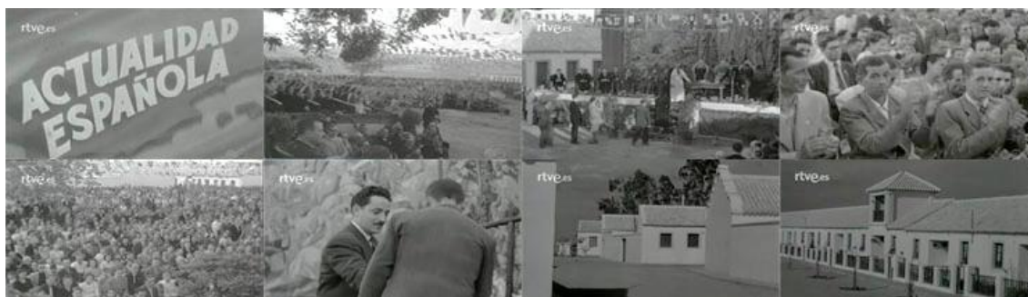
Sec. 4. Secuencia de planos del capítulo. NOT N 336-A, junio 1949. Capturas realizadas en la página del Archivo NO-DO

Otras viviendas que también se han inaugurado entre una multitud que adornaba sus balcones, son las de Mejorada del Campo, el gobernador y jefe provincial del movimiento en Madrid es el que hace entrega de un total de cuarenta y cuatro viviendas, a las que la voz en off reseña como hogares cómodos y sanos las cuales forman parte del grupo Ramiro Ledesma Ramos. Las imágenes también nos muestran cómo se han pronunciado los pertinentes discursos de las autoridades que están presentes, el locutor nos habla del esfuerzo de reconstruir España con afán de superación creciente se realiza en la patria . Observamos que no es una entrega de llaves, o entrega de escrituras, las casas ya están habitadas, la inauguración se ha celebrado con posterioridad, pues se aprecian en las imágenes la ropa tendida, el conjunto de casas es nuevo, de ahí que todavía no se aprecien en las imágenes las infraestructuras urbanísticas necesarias, como es un acerado o iluminación de las calles.