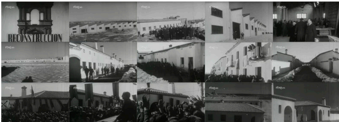
Sec.3. Secuencia de planos del capítulo NOT N 66- A, abril, 1944. Capturas realizadas en la página del Archivo NO-DO.

Regiones Devastadas realizó una extensa labor en cuanto a la reconstrucción de lo que estaba casi destruida y en el impulso de nuevas construcciones, en muchos de esos casos la mayoría fue destinada a viviendas, pero en otros casos se decantaron por incentivar otros sectores como era la industria. En este ejemplo (NOT N 66- A, abril, 1944) que hemos seleccionado comprobamos la labor que realizó esta Institución. Así las imágenes seleccionadas, se encuentran enmarcadas dentro del epígrafe Reconstrucción, y en ellas se nos muestra como en Lérida se hará entrega por parte del Director de Regiones Devastadas, José Moreno Torres, de unas obras que han durado unos tres años y en las que se ha invertido un presupuesto de más de 23.000.000 de pesetas, destinadas ellas a talleres en los que trabajan aproximadamente mil quinientos obreros de toda la comarca. En las imágenes se aprecian una comitiva que se dispone a aproximarse hacia los talleres para hacer visita, junto al Director Moreno Torres, le acompaña la autoridad eclesial pertinente. Cuando todavía la locución nos habla acerca de los talleres, las imágenes nos introducen otra obra nueva que va a ser inaugurada gracias a Regiones Devastadas, es la construcción de viviendas en el pueblo Villanueva de la Barca, pues muchas cerca de cien familias habían perdido sus casas, y según la voz en off, las casas que ahora disfrutan con hogares confortables y alegres .