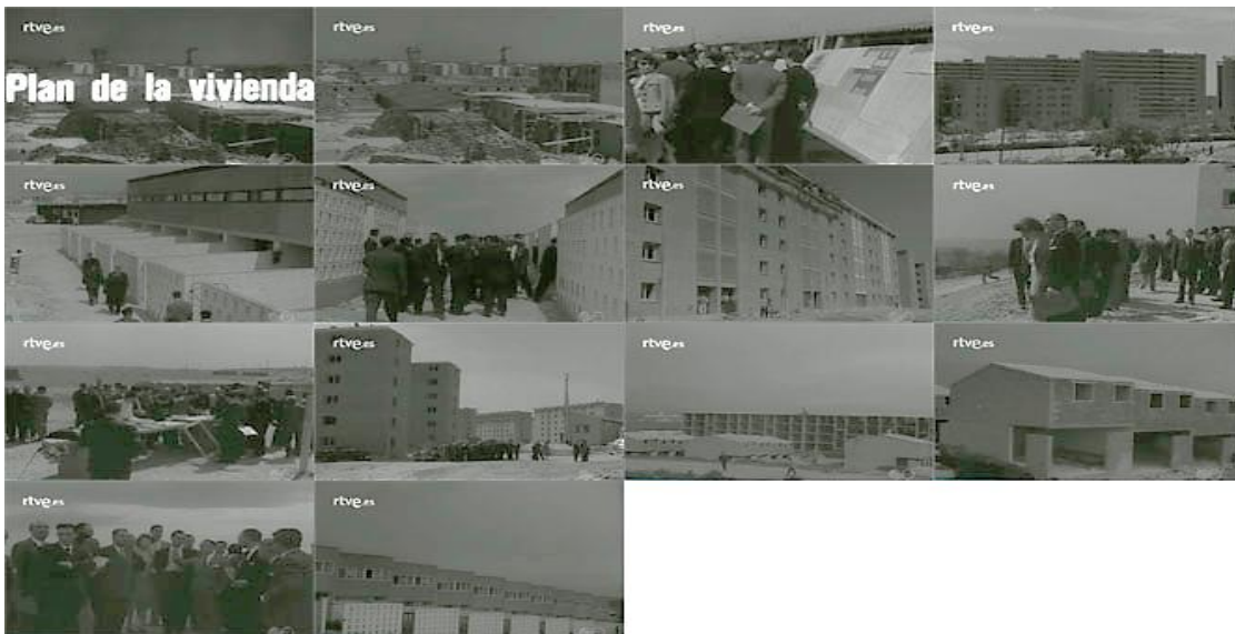
Sec. 6. Secuencia de planos del capítulo. NOT N 802-A, mayo, 1958. Capturas realizadas en la página del Archivo NO-DO

ciudades con más población, el problema era mayor. De este modo vemos el ejemplo del Plan de Vivienda de Madrid (NOT N 802-A, mayo, 1958) llevado a cabo en los finales de los años cincuenta. En esta ocasión un grupo de periodistas visita una de las zonas donde se encuentran una buena parte de estas nuevas construcciones, algunas de ellas ya están próximas a ser concluidas. La secuencia de imágenes nos muestra una intensa actividad arquitectónica, a los periodistas se les ha facilitado tener acceso a diferentes planos de alzando, sección y planta. En esta zona se albergan casi la mitad de este plan de urgencia social, que se ha establecido en Madrid, se dotará a la ciudad de un total de 60.000 viviendas. Esta inversión de dinero y suelo ha supuesto también una adecuación de urbanismo y de comunicación por carretera, para lo cual se está construyendo una autopista de circunvalación, pues la zona nueva que ha emergido gracias a este plan, ha supuesto la construcción de unos siete polígonos urbanos.