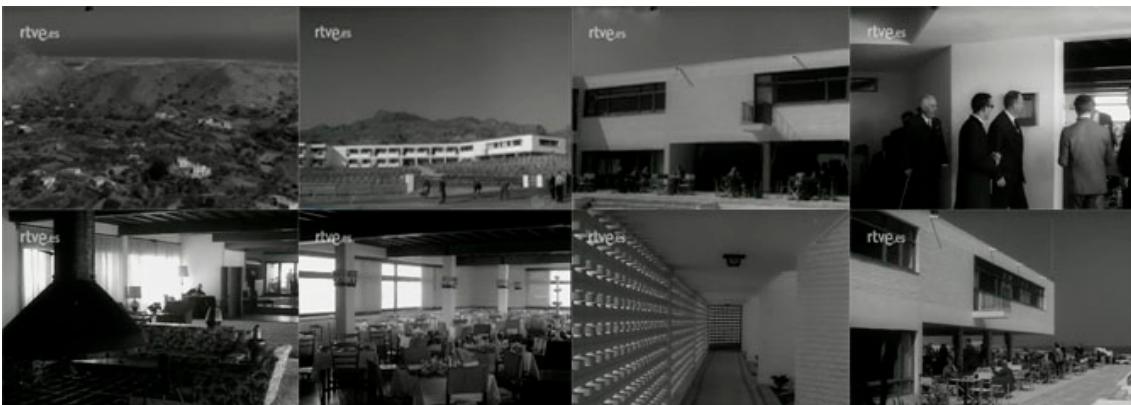
Sec. 18. Secuencia de planos del capítulo. NOT N 1210-B, 1966. Capturas realizadas en la página del Archivo NO-DO.

Otro ejemplo de Parador es el de Mojácar (NOT N 1210-B, 1966), parador número 50 y que está situado junto al mar, constituyendo uno de los ejemplos más