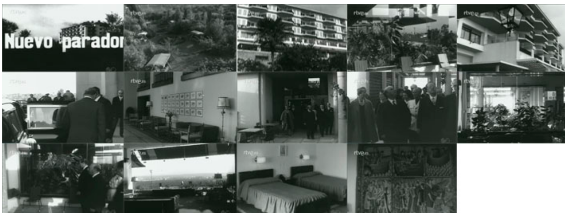
Sec. 17. Secuencia de planos del capítulo. NOT N 93-C1960. Capturas realizadas en la página del Archivo NO-DO.

En la ciudad de Córdoba encontramos otro ejemplo de Parador, es la Arruzafa, (NOT N 934-C, noviembre, 1960). En la secuencia de imágenes seleccionadas encontramos como es Franco quien inaugura estas nuevas instalaciones, en compañía de su esposa, diferentes ministros y personalidad. Este parador fue mandado construir por la Dirección General de Turismo, el cual está provisto de cuatro plantas con 56 habitaciones dobles, también está dotado de los últimos adelantos, así como de espacios diáfanos y confortables, que disfrutan de la ubicación del parador en un paisaje excepcional, la sierra cordobesa; como afirma el narrador el Parador de la Arruzafa se iguala en gusto y comodidad de los mejores establecimientos extranjeros.