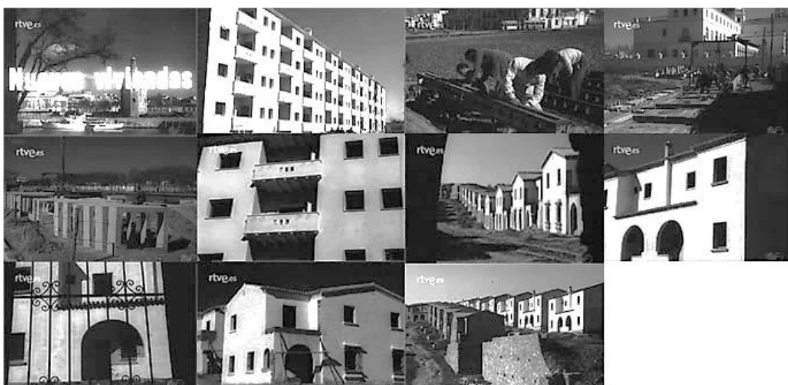
Sec. 5. Secuencia de planos del capítulo. NOT N 532 -B, marzo, 1953.

Las barriadas de casas económicas fueron otro hábito común de estos años, uno de los ejemplos que hemos seleccionado se desarrolla en Sevilla, concretamente en el barrio de Nervión. (NOT N 532-B, MARZO, 1953) En este capítulo se hace entrega de este tipo de viviendas, las cuales han sido construidas en cadena, lo que ha permitido abaratar los costos, el tiempo y la mano de obra. La novedad que nos cuenta la voz en off, es que el primer bloque se construyó en un periodo máximo de 50 días y en total comprende 40 viviendas, la capacidad de los edificios ha permitido que se den dos tipologías. El coste total del primer bloque ha sido de 1.750.000 pesetas, y se ha comenzado el segundo bloque, y está previsto construir más bloques con esta metodología.