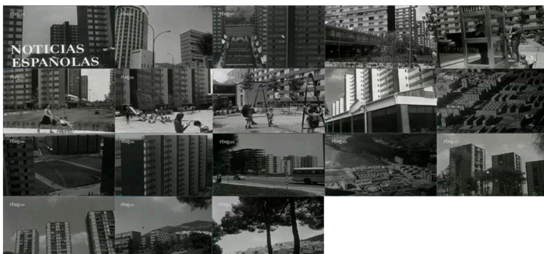
Sec. 10. Secuencia de planos del capítulo. NOT N 133 -A, agosto, 1968. Capturas realizadas en la página del Archivo NO-DO

Una de las tendencias arquitectónicas para paliar el problema habitacional, que todavía se vivía en España en los años sesenta, fue la construcción de grandes polígonos populares de vivienda, que permitían en menor desarrollo de terreno albergar en vertical innumerables viviendas. Uno de estos casos lo vemos en desarrollado en Barcelona. (NOT N 1337-A, agosto, 1968). En este capítulo observamos entre otras cuestiones como el encabezado del epígrafe ha cambiado a ser Noticias Española. Las imágenes nos muestran diversos ejemplos de polígonos que se han ido construyendo en el extrarradio de la ciudad condal. El primer caso se desarrolla en la zona conocida como el Biche. Por medio del Patronato Municipal de Viviendas, se han construido en esta zona desde la fundación del polígono más de 2.000 viviendas, las cuales han llegado a ser ocupadas por 12.000 personas aproximadamente, y todo apunta a que se seguirá ampliando, pues según comenta el narrador se está construyendo con celeridad. El terreno ocupado es de 70 hectáreas, lo que permitirá que en este polígono lleguen a vivir