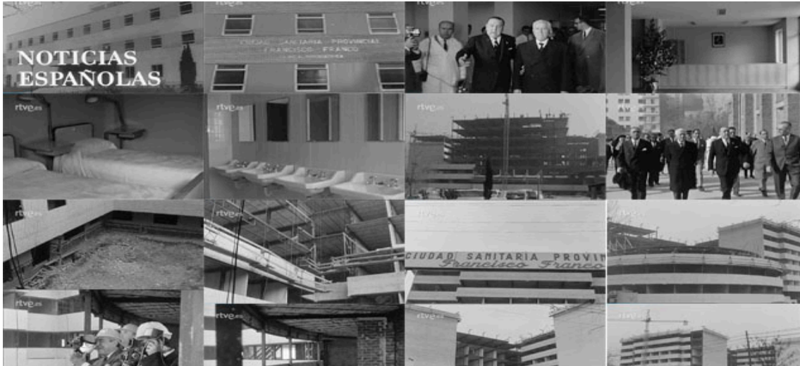
Sec. 15. Secuencia de planos del capítulo, NOT N 1252-C- , enero, 1967. Capturas realizadas en la página del Archivo NO-DO.

Finalmente el último ejemplo escogido es aquel que nos muestra los avances en la ciudad sanitaria que lleva por nombre Francisco Franco, en Madrid. (NOT N 1252-C, enero, 1967) Ahora se inaugura uno de los edificios que es parte de este gran complejo sanitario, una clínica psiquiátrica con capacidad para 140 camas y está dotada de los últimos avances de esta especialidad médica.