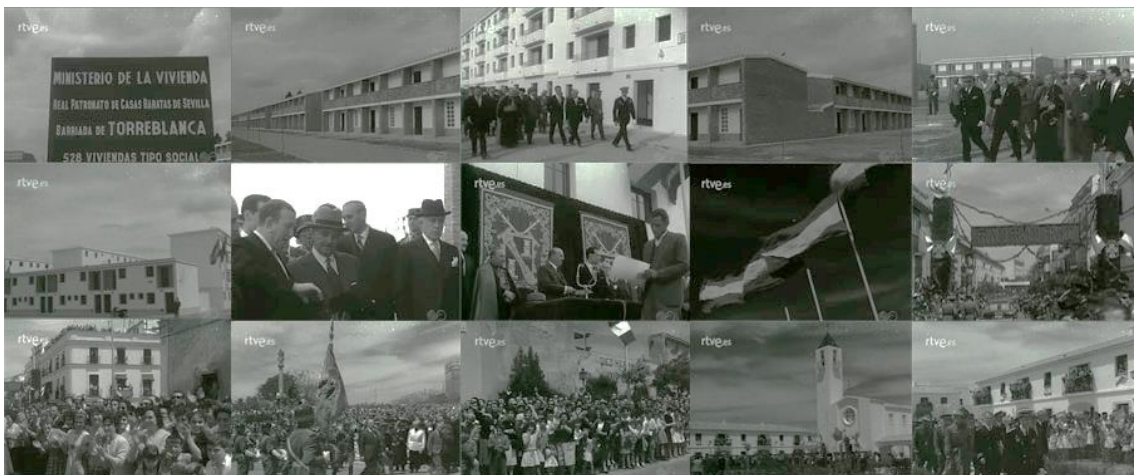
Sec. 7. Secuencia de planos del capítulo. NOT N 957-B, mayo, 1961.

La primera de las barriadas mencionadas es inaugurada por Franco, en total se han construido 528 viviendas de tipo social, y tiene capacidad para 1608 familias. El objetivo concreto de esta nueva barriada viene a suplir las malas condiciones en las que estaban anteriormente a estas viviendas, pues esta zona se había convertido en un suburbio, y ahora sin embargo según el narrador se le está otorgando el regalo de tener hogares limpios y decorosos .