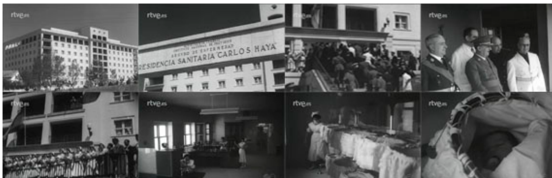
Sec. 13. Secuencia de planos del capítulo. NOT N 696- A, mayo, 1956.

pabellón de Poliomiélitis o la casa cuna, todos estos edificios están dotados de los últimos avances tecnológicos. Así la voz del narrador ensalza la labor que se está desarrollando en España, constituyendo estos ejemplos con notorios avances así como modelo y ejemplo dentro de este género .