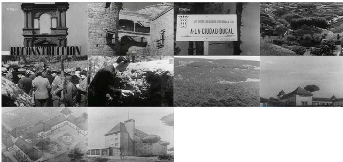
Sec. 2. Secuencia de planos del capítulo NOT N 27 A, julio, 1943. Capturas realizadas en la página del Archivo NO-DO

A 1.233 metros de altura se ubicó como tarea de reconstrucción la nueva ciudad Ducal de las Navas del Marqués, provincia de Ávila (NOT N 27 A, julio 1943). En este ejemplo se observa la inauguración de las obras, que dará lugar a 180 viviendas más una iglesia. La Institución que impulsa estas edificaciones es la Unión Resinera Española, y éstas están destinadas para el descanso estival de los resineros.