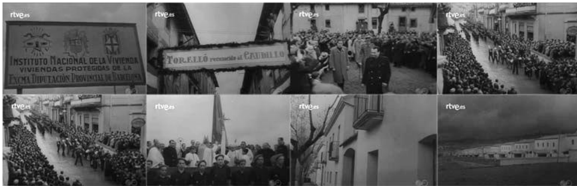
Sec. 1. Secuencia de planos del capítulo NOT N 16, abril, 1943. Capturas realizadas en la página del Archivo NO-DO

Finalmente se nos muestran las hileras de casas en un terreno que puede parecer que todavía carece de urbanización. El proyecto (fig.1) de dicha casas fue realizado por Antonio Pineda Gualba 34 , arquitecto de la Delegación Comarcal de Barcelona, Tarragona y Girona. Esta localidad fue adoptada por el Caudillo en 1942 debido a la tragedia de las inundaciones ocurridas en 1940 35 .