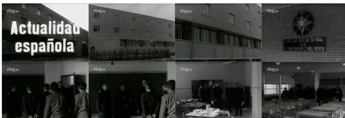
Sec. 14. Secuencia de planos del capítulo. NOT N 938- B, diciembre 1960.

Dentro del epígrafe actualidad española, encontramos un capítulo de NO-DO, en el que se nos muestra la inauguración de una escuela para hijos y huérfanos de suboficiales. La escuela de Nuestra Señora del Carmen ubicada en la ciudad lineal de Madrid, (NOT N, 938- B, diciembre, 1960), está destinada a huérfanos e hijos de suboficiales de la marina, construida en un solar de más 3.90 m 2 , la cual ha sido inaugurada por el Ministro de la Marina, el Almirante Amaruza, y otras autoridades. Esta escuela cuenta con 138 plazas en régimen de internado, y en ella se impartirá la enseñanza primaria y el bachillerato, para finalmente poder realizar los estudios en la marina mercante.