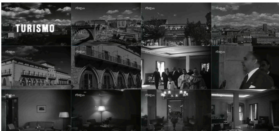
Sec. 16. Secuencia de planos del capítulo. NOT N 714-B, 1956. Capturas realizadas en la página del Archivo NO-DO.

Observamos en la búsqueda realizada en NO-DO que la inauguración de Paradores Nacionales aparece con más frecuencia a partir de la mitad de los años cincuenta. Esto podría estar relacionado con la apertura económica que se está comenzando a experimentar, pues aunque en los primeros años si hubo alguna actividad en el sector turístico, lo cierto es que la urgencia que planteaba el problema de vivienda no permitió muchos avances en el sector turístico. Así hemos querido destacar aquellos paradores que tanto por su tratamiento en el Noticiero que nos ocupa, como por su representación arquitectónica, suponen un ejemplo para nuestro estudio. Aunque es evidente que en estos años comienzan las construcciones hoteleras, hemos querido posar nuestra mirada en el papel que cumplieron los paradores, como construcción turística impulsada por el régimen franquista.