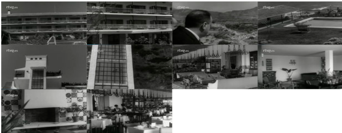
Sec. 19. Secuencia de planos del capítulo. NOT N 1211- B, 1966. Capturas realizadas en la página del Archivo NO-DO.

Con el ejemplo del Parador Nacional de Nerja (NOT N 1211-B, 1966) se quiere destacar lo acometido hasta el momento, en lo que se refiere a la ampliación de instalaciones turísticas en España, que viene a suplir en muchas ocasiones la iniciativa privada, en este parador llama nuestra atención, la instalación de una torre que alberga el ascensor diseñado para facilitar el acceso a la playa, y así salvar el desnivel entre la tierra firme y la playa.