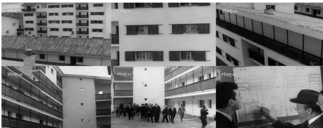
Sec. 9. Secuencia de planos del capítulo. NOT N 1206 -A, febrero, 1966.

Una de las tendencias arquitectónicas para paliar el problema habitacional, que todavía se vivía en España en los años sesenta, fue la construcción de grandes polígonos populares de vivienda, que permitían en menor desarrollo de terreno albergar en vertical innumerables viviendas. Uno de estos casos lo vemos en desarrollado en Barcelona. (NOT N 1337-A, agosto, 1968). En este capítulo observamos entre otras cuestiones como el encabezado del epígrafe ha cambiado a ser Noticias Española. Las imágenes nos muestran diversos ejemplos de polígonos que se han ido construyendo en el extrarradio de la ciudad condal. El primer caso se desarrolla en la zona conocida como el Biche. Por medio del Patronato Municipal de Viviendas, se han construido en esta zona desde la fundación del polígono más de 2.000 viviendas, las cuales han llegado a ser ocupadas por 12.000 personas aproximadamente, y todo apunta a que se seguirá ampliando, pues según comenta el narrador se está construyendo con celeridad. El terreno ocupado es de 70 hectáreas, lo que permitirá que en este polígono lleguen a vivir