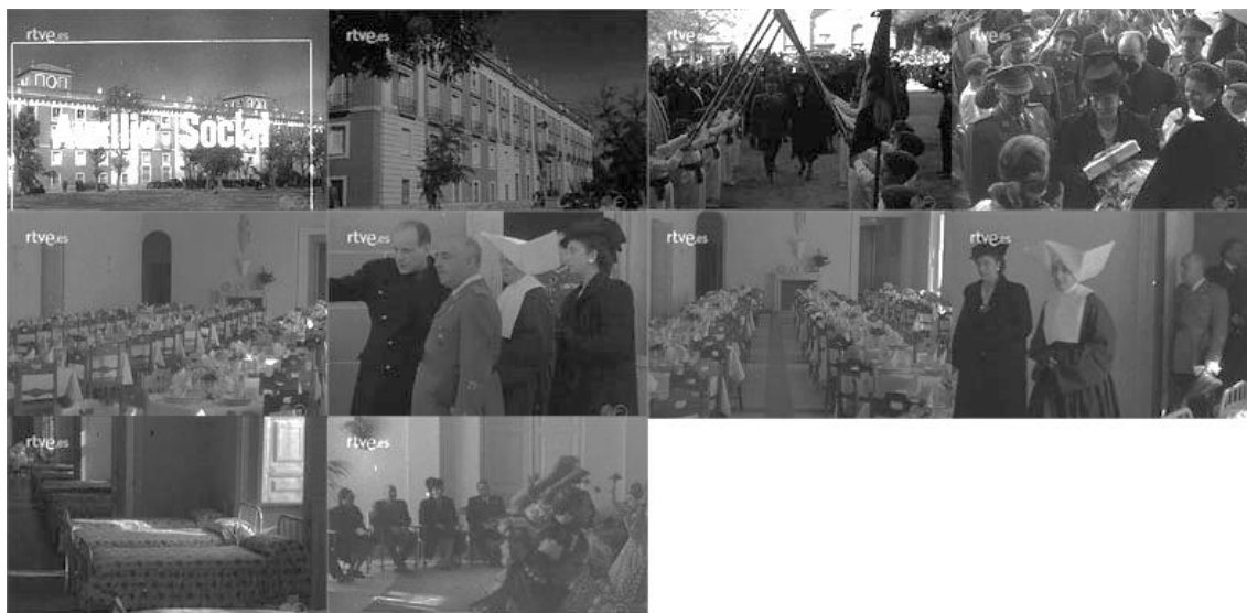
Sec. 12. Secuencia de planos del capítulo. NOT N 150-A, noviembre, 1945.

un tiempo anterior, podríamos decir que resalta un cierto estilo anclado en modelos del pasado.