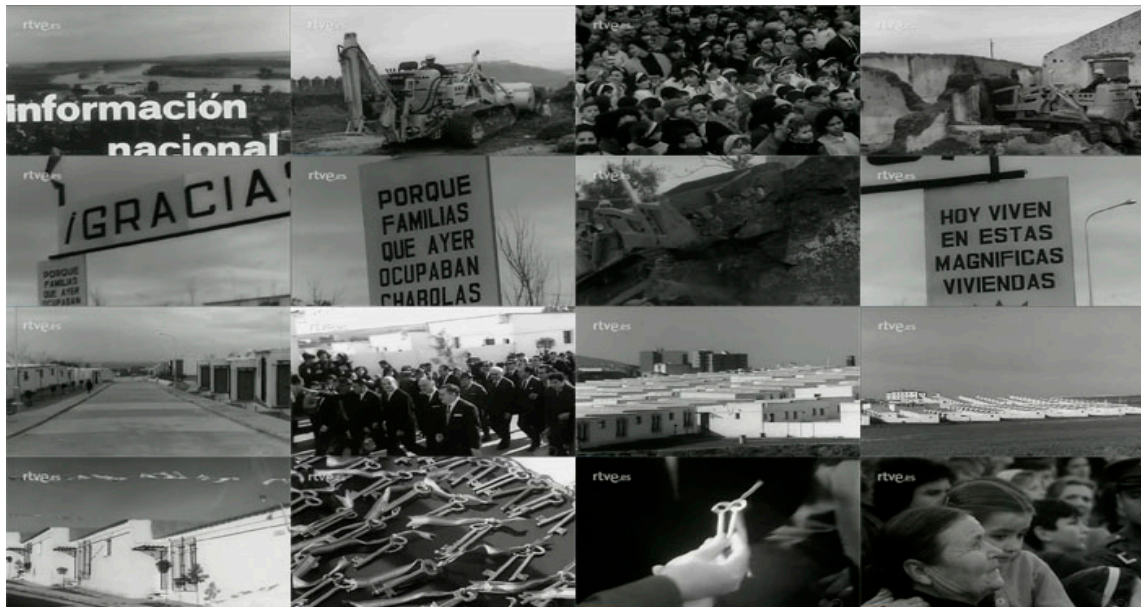
Sec. 8. Secuencia de planos del capítulo. NOT N 1206 -A, febrero, 1966.

Otra imagen que nos devuelve la cámara es una nueva barriada blanca en Mérida, que ha surgido al calor del desarrollo de España , como afirma la voz del narrador. Nuevas construcciones se han levantado en Cardenal de la Sierra, que consisten en bloques de viviendas en altura, en los que destacan las persianas correderas horizontales, que nos recuerdan a la arquitectura que ya se promoviera en Alemania con la Bauhaus, aunque aquí la techumbre se sigue representando a dos aguas. En estos nuevos barrios y edificaciones se aprecian las disposiciones ortogonales de calles y casas, esquemas rectilíneos y exentos de ornamento, que de nuevo evidencian la penetración de los principios de la arquitectura del movimiento moderno que tanto proclamó Le Corbusier a principios de siglo, y lo más destacable aquí a nuestro modo de ver, es que aquí ya se están separando de la idea de hogar asimilada únicamente a una vivienda de una sola planta y de carácter unifamiliar, ya comienzan a emerger los bloques de pisos, que resultan en ocasiones más baratos porque la adquisición de suelo no es tan extensa.