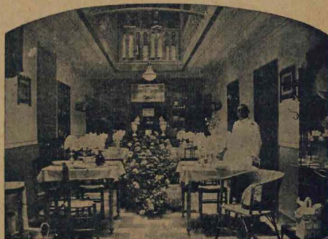
Una vista del comedor

PARA LA SALIDA DEL TEATRO, EXQUISITO :-: CHOCOLATE CON PICATOSTÉS. :-: