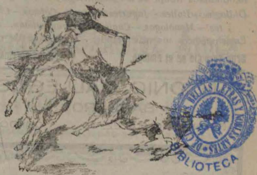
Cañero banderilleando a caballo.