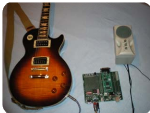
Pedal de efectos para guitarra eléctrica

Los proyectos pueden ser propuestos tanto por los alumnos como por el profesor, en el primer caso, el profesor decide si tienen complejidad suficiente y cuál es la nota máxima que puede alcanzar el alumno con ese trabajo. Algunos de ellos se muestran a continuación: