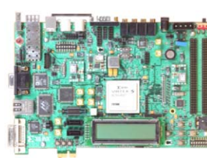
Multiprocesador T1 SUN OpenSparc