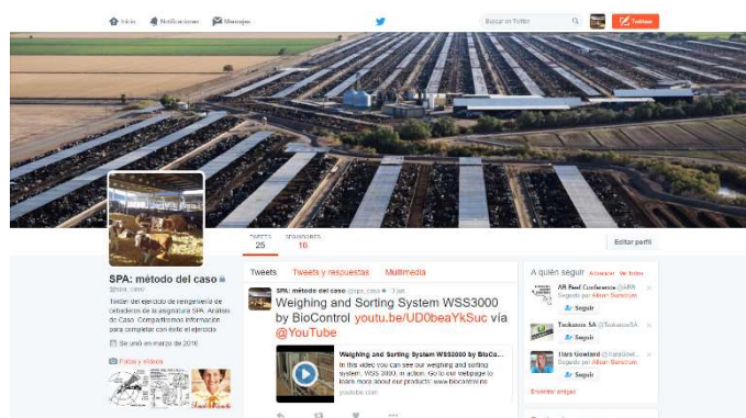
Figura 2. Cuenta de Twitter utilizada para compartir información con los alumnos.

De cara a completar la búsqueda de información de los alumnos se creó una cuenta de Twitter (Figura 2) en la que el profesorado compartió periódicamente datos relacionados con el caso (un total de 25 tweets).