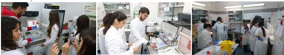
1. Fotografías de los alumnos participantes en la actividad durante la fase experimental de la misma.