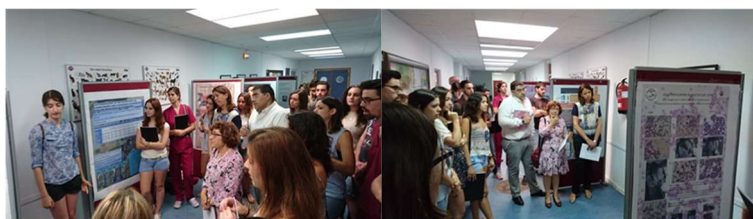
2. Varias imágenes de la sesión de defensa de los trabajos de investigación, con los alumnos participantes explicando sus experimentos y resultados al jurado del Congreso.

Como una forma de fomentar la participación en esta actividad, así como para aumentar el grado de emprendimiento e implicación científica en las fases anteriores, el jurado seleccionó el trabajo ganador en función de lo expuesto en los journals así como la defensa oral realizada ante los pósters. El material que se generó en esta fase quedó en exposición pública para su consulta por parte de otros alumnos de veterinaria en las instalaciones del Hospital Clínico Veterinario y Dpto. de Medicina y Cirugía animal.