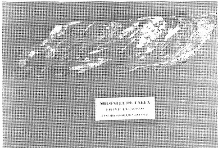
Milonita de Falla.

MINERÍA ROMANA. Los romanos explotaron las minas de la faja pirítica belmezana de hierro y cobre aurífero como La Loba, La Pastora, La Gata, Parrilla-Víboras. Nava Paredón, Berrazas, La Campana y Los Cabriles, hasta Cerro Muriano. Existen razones para postular que el municipio de Belmez es Mellaria, está atravesado por la gran calzada