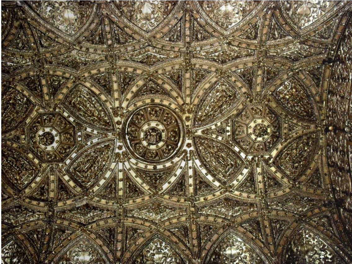
Fig. 6. Forro da Capela-mor da Igreja de Jesus, séc. XVIII.

O ático não se fecha na composição do retábulo e avança sobre o plano arquitectónico da cabeceira-mor e cobre todo o camarim, dinamizando um fecho definido por três arcos concêntricos em forma de arquivoltas de fuste espiralado, intersetado por cinco aduelas radiais e rematando no fecho, ao centro do arco superior, com um brasão de armas da Casa Real, ao tempo de D. João V. (Fig. 6)