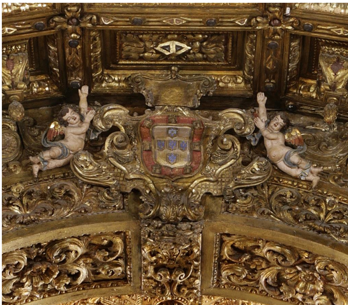
Fig. 3. Arco Cruzeiro da Igreja de Jesus e Armas de D. Pedro II, séc. XVIII.

Partindo do pressuposto que a intenção principal da obra de talha que reveste a Igreja de Jesus era a de mostrar aos fieis representações figurativas de ciclos religiosos complementados com a vida de santos, e, no caso específico do Mosteiro de Jesus, o desígnio de narrar a vida da Princesa Santa Joana apelando á sua santidade, a “longa duração” 20 que é inerente às várias campanhas de obras ali operadas leva-nos a diferenciar as diversas fases estilísticas e propósitos religiosos intrincados com a invenção da criação artística.