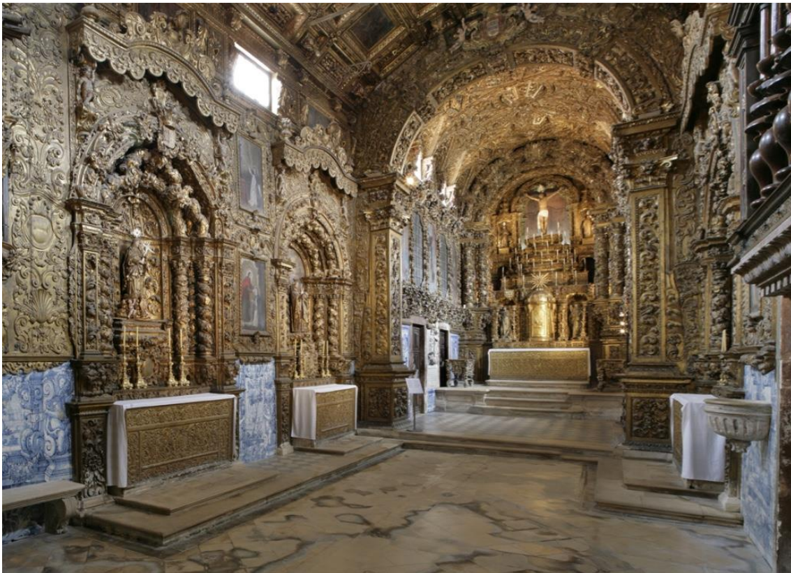
Fig. 4. Retábulos da Nave Central da Igreja de Jesus, séc. XVII-XVIII.