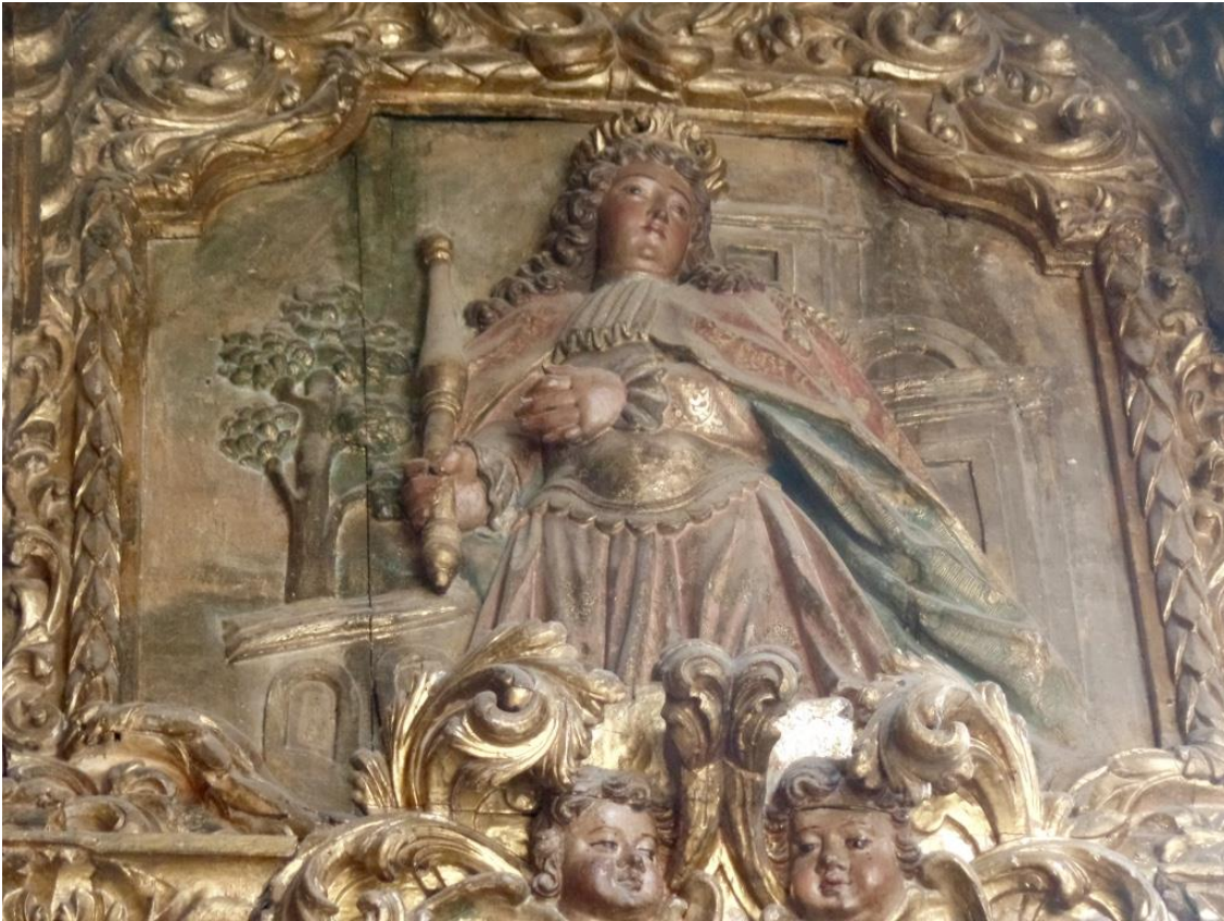
Fig. 8. Painel alegórico da “Virtude” simbolizando a justiça e a reverência na cimalha da Capela-mor da Igreja de Jesus, séc. XVII.