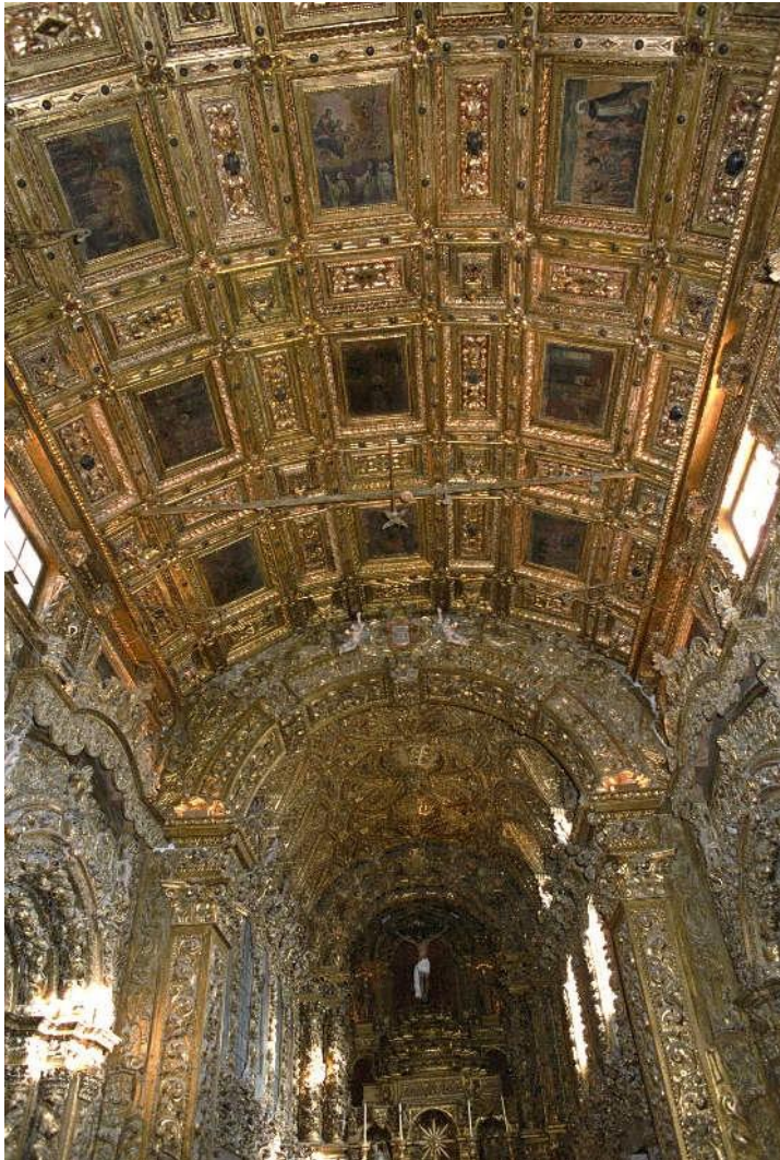
Fig. 1. Forro da Nave da Igreja de Jesus, séc. XVII.

O revestimento interno da Igreja de Jesus foi resultado de vários períodos e consequentemente de avultados recursos financeiros provenientes da comunidade religiosa residente e ainda de privados, como os Tavares, os Duques de Aveiro, e a casa Real que assumiu papel relevante pelos subsídios avultados que atribuía ao Convento e pelas obras que empreendeu na Igreja de Jesus. (Fig. 1)