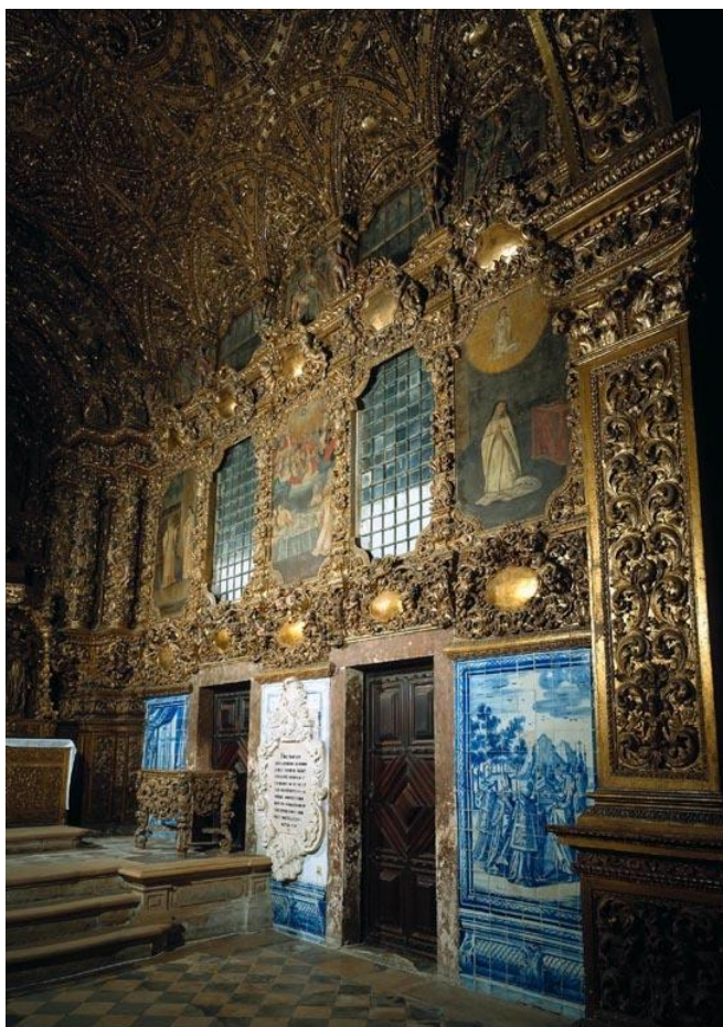
Fig. 7. Capela-mor da Igreja de Jesus, revestimento integral, séc. XVIII.

É assinado um contrato entre as religiosas do Convento de Jesus e os Frades Dominicanos e entre estes e o senado da Câmara para redução do terreiro dos frades em benefício do alargamento do terreno à volta da Capela de Jesus para alargamento da Capela-mor. Este acordo implicava manter a rua da Corredoura com a largura adequada a uma artéria principal de acesso à vila de Aveiro, por onde corriam as carruagens e demais veículos, na perpendicular à Porta do Sol, a este da cintura muralhada da villa . (Fig. 7)