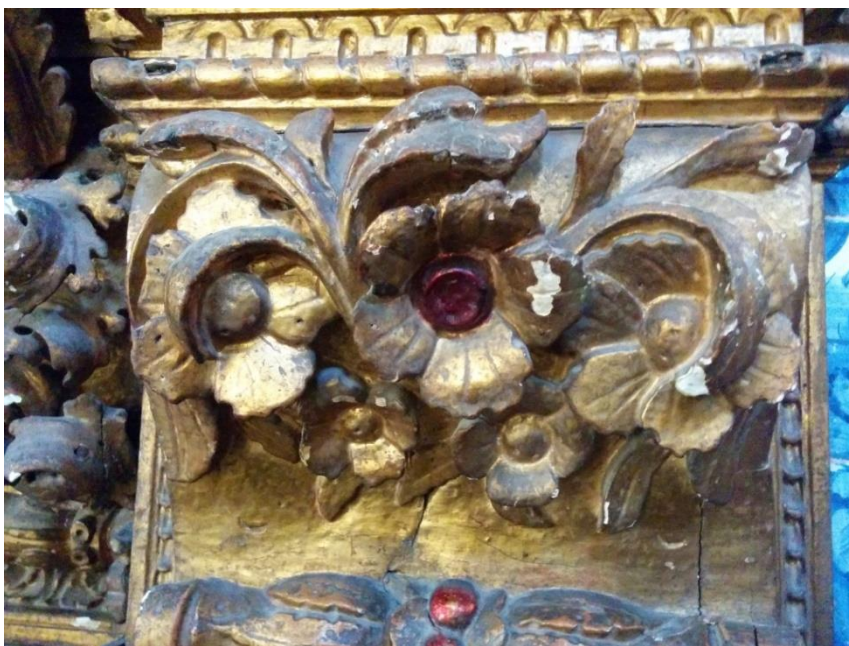
Fig. 5. Elemento fitomórfico com aplicação de glaciis imitando um rubi, séc. XVIII. Fotografia: Maria da Luz Nolasco Cardoso [MLNC].

Destaque para a colocação de uma terceira coluna entre as duas de fuste espiralado, posicionada em cada uma das ilhargas. Este par de colunas tem continuidade no arco de igual entalhe, ficando na sombra do arco tricêntrico do primeiro plano do ático, remetendo este elemento para um período posterior. A coluna de fuste estriado desde a base até ao capitel coríntio, tem grinaldas entrecruzadas serpenteando o fuste; este elemento arquitectónico foi acrescentado posteriormente, desconhecendo-se a base documental da sua encomenda e risco. Pela análise formal da peça pode ser do período da obra da Capela-mor da Igreja. O arco tricêntrico está amputado nos extremos. Este retábulo deve-se à Priora D. Ana de Belém (1691-1693) sendo contemporâneo dos dois retábulos na nave da Igreja (Domingos Maurício, 1967, p. 11). (Fig. 5)