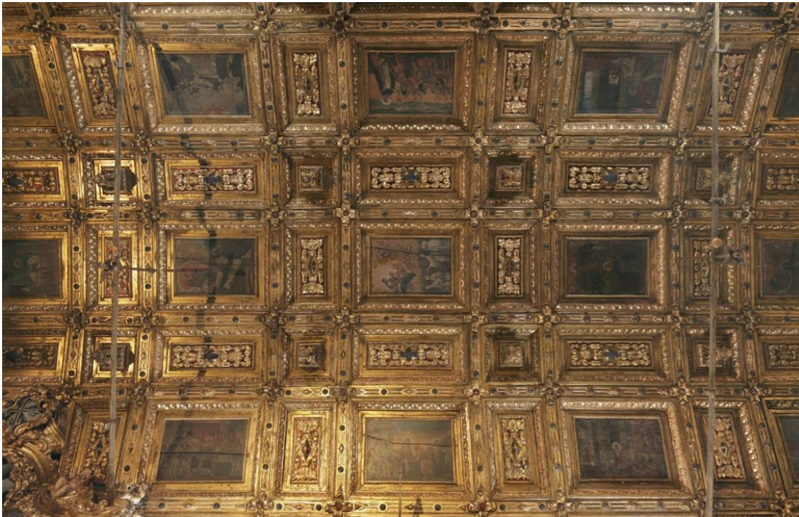
Fig. 2. Detalhes do Forro da Nave da Igreja de Jesus. Integração nos lisos de pinturas sobre tábua, séc. XVII.

seguidas de modilhões (consolo em folha de acanto turgido) e painel relevado com ponta de diamante de cor carmim inscrita em cartela de talha dourada. Estes termos técnicos são essenciais à interpretação de muita da documentação dos séculos XVII e XVIII. Documentação respeitante a contratos de obra de talha, de assemblagem e montagem do conjunto retabular em local previamente designado, de douramento e de estofos de imagens, de douramento e de pintura das obras provenientes de encomendas que gravitavam, na sua essência, em torno da Igreja, configurando-lhes o espaço arquitetónico e a estética do ministério. (Fig. 2)