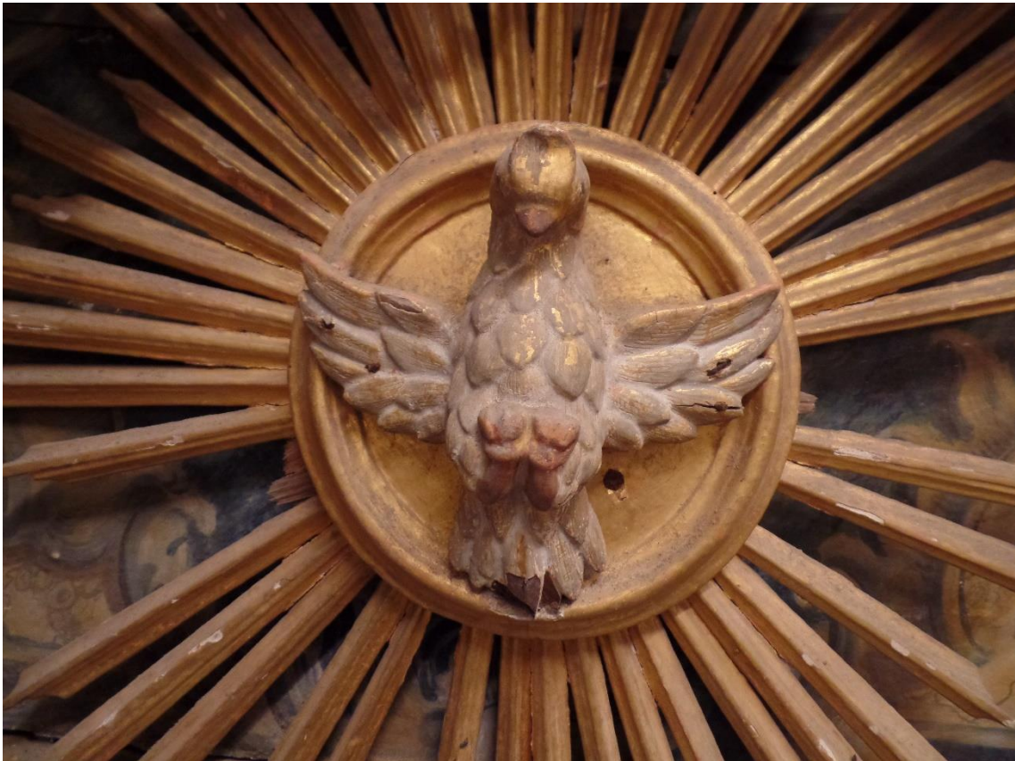
Fig. 10. Sacrário do Retábulo de Altar da Capela-mor da Igreja de Jesus, séc. XVIII.