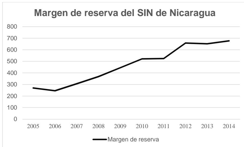
Gráfico 3. Margen de reserva del Sistema interconectado nicaragüense 2005 al 2014 en MW.

El gráfico 3 muestra el superávit de potencia de la MEN, se observa que Nicaragua desde años anteriores ha tenido un sistema con sobrecapacidad instalada. Pero esto no brinda información acerca de la operación del sistema sino que muestra que el sistema estaba en capacidad de cubrir la demanda con la potencia instalada efectiva, situación que presenta claramente las limitaciones de este indicador, que no toma en cuenta la operación del sistema sino que únicamente se centra en la capacidad total disponible, sin considerar incidentes negativos que afecten la disponibilidad de unidades o plantas de generación de energía eléctrica enteras. Limitaciones como reservas de los