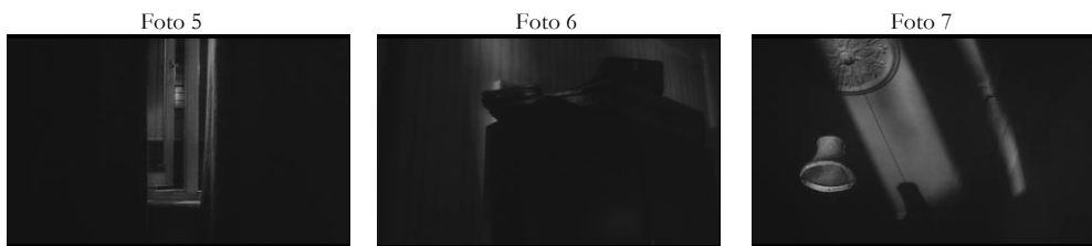
Fuente: Capturas de pantalla del DVD de «Repulsión». Edición «Fnac». Distribuidora «Avalon».

La imagen pasa a un fundido a negro. Llega la noche y mediante una serie de planos, se nos presenta una de las habitaciones más importantes del apartamento: el cuarto de Carole. En primer término, vemos la ventana que da vistas a ese convento de «vida pura» antes citado. Inmediatamente después se introducen en la banda sonora las risas de excitación del cuarto de al lado. Dicho cuarto es el cuarto de Helen, quien ahora está intimando con Michael. La cámara capta planos de determinados elementos de la habitación de Carole que luego adquirirán relevancia en el film, como la lámpara, cuyo detalle se verá hacia el final del trabajo.