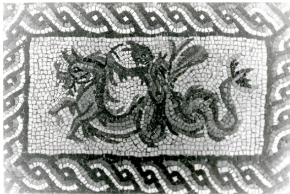
Fig. 8. Mosaico de Océano hallado en Ronda de Tejares 13 (Córdoba). Detalle del tritón.