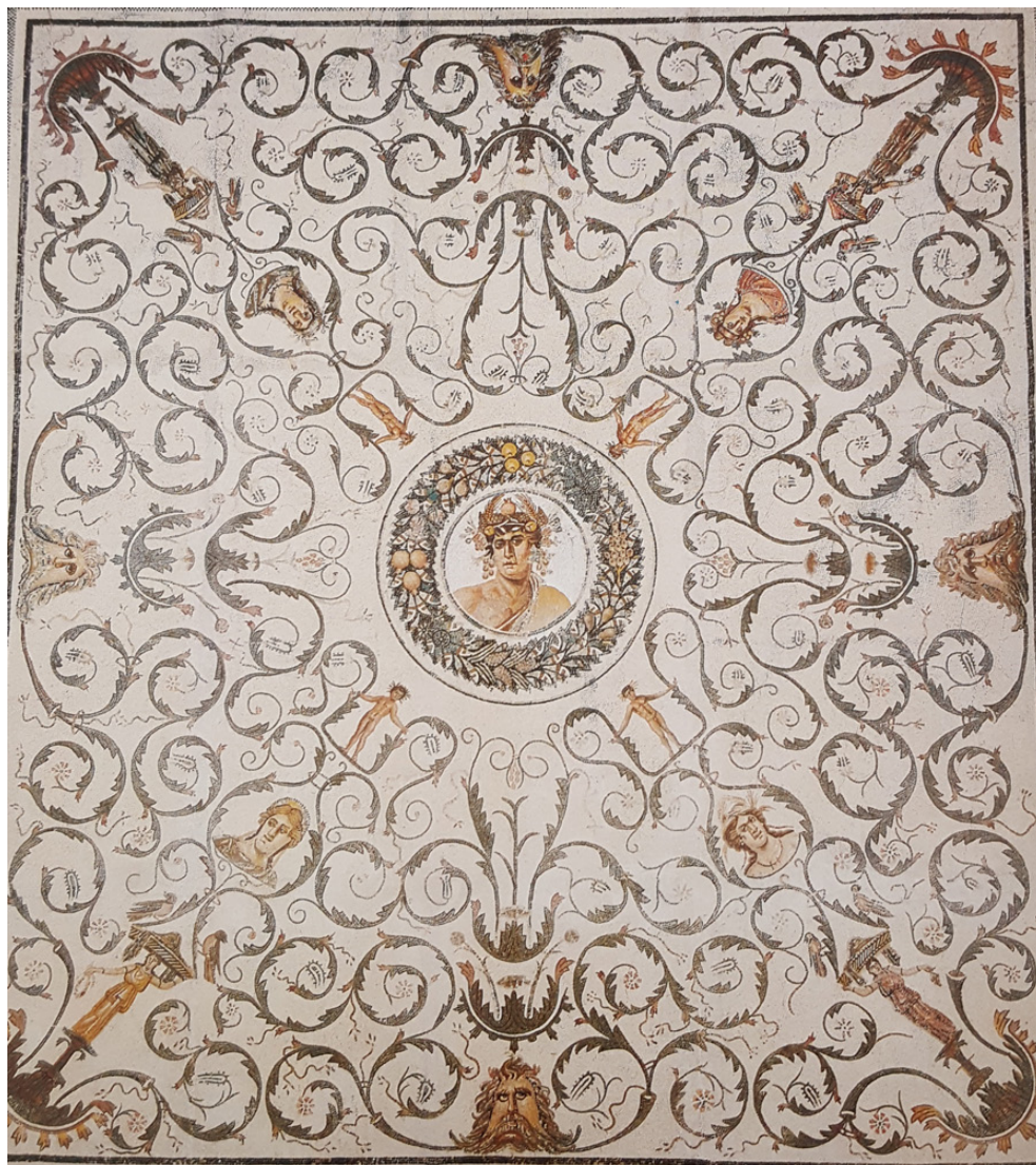
Fig. 7. Mosaico de Anus y las Cuatro Estaciones de Thysdrus que se conserva en el Museo de El Djem.

XXXIV, III; Clarke, 1979: 62) e Iguvium , fechado en el siglo IV d.C. (Stefani, 1942: 372-373) y en el polícromo de Orciculum , entre el 115 d.C. y años siguientes (Guattani,