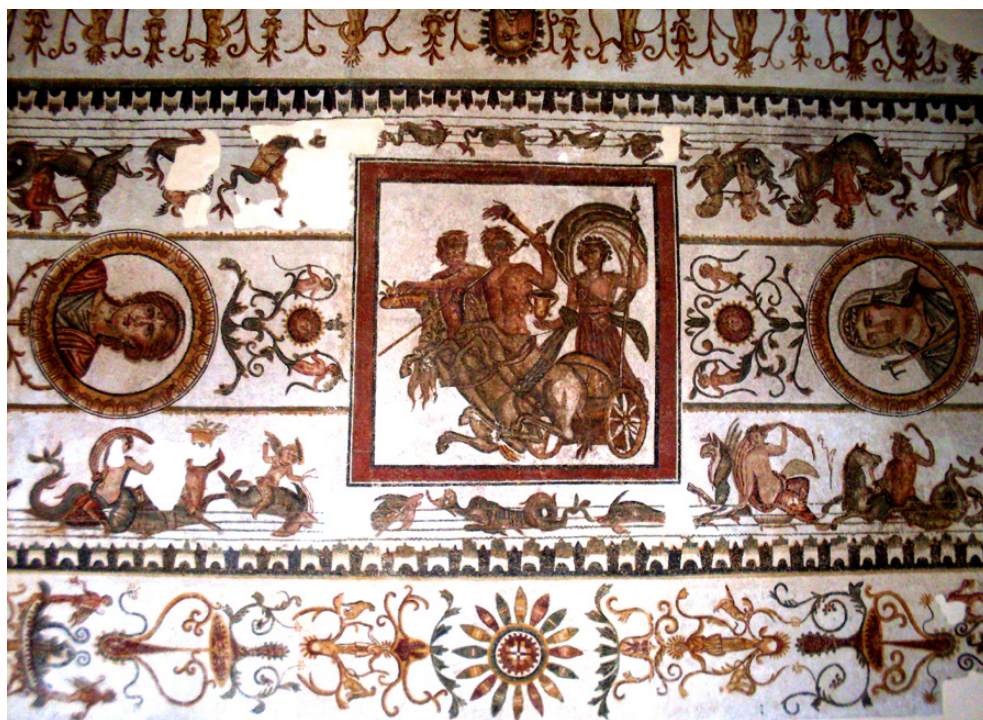
Fig. 5. Mosaico del triunfo de Dioniso de las Termas de Acholla. Foto: Según M. Rais

determinando como resultado, en lugar de triángulos, ocho deltoides convexos como los documentados en un mosaico de Bignor (Rayney, 1973: 106, fig. 10b; Balmelle et alii , 2002: pl. 381b), que presenta una composición similar, pero basada en un octógono no dispuesto sobre la punta.