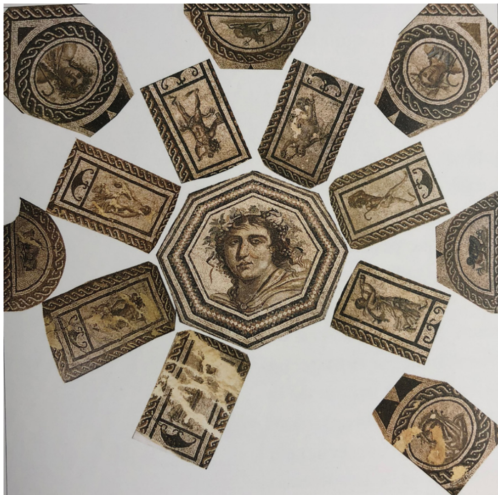
Fig. 3. Mosaico del busto de Dioniso. Extramuros área septentrional. Reconstitución de G. López Monteagudo.

muros (Blázquez, 1981: núm. 12, láms. 13-16, fig. 13), que fueron restaurados y trasladados al Palacete de la familia Cruz Conde en la calle de Torres Cabrera (Moreno, 1996: E-2-5-E-2-9bis) y entre cuyos fragmentos fechados entre finales del siglo II y principios del III, se cuenta el busto de Dioniso ( Fig. 3 ), y uno de los mosaicos de la villa de Alco-