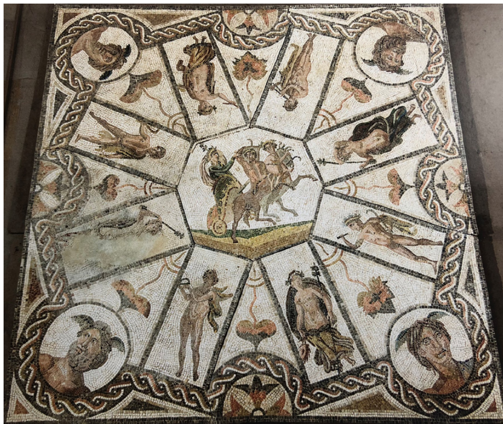
Fig. 4. Mosaico del Triunfo de Dioniso de la villa de Alcolea.

en un cuadrado y alrededor de un octógono sobre la punta, de ocho rectángulos laterales según el eje de las medianas del octógono, adyacentes al octógono y contiguos al cuadrado, y de cuatro círculos en los ángulos y cuatro semicírculos laterales tangentes a los rectángulos, determinando triángulos, en trenza (Balmelle et alii , 2002: pl. 381c). Y posiblemente sea idéntica también a la composición de otro mosaico cordubensis , del que se conservan tres fragmentos con representación de las Estaciones hallados en la zona del Banco de España en la Avda. del