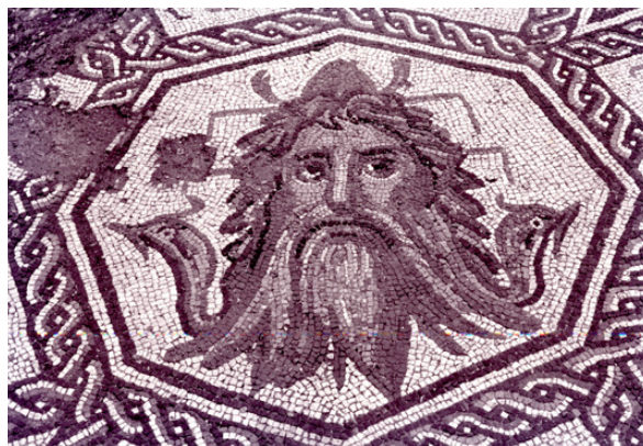
Fig. 2. Mosaico de Océano hallado en Ronda de Tejares 13 (Córdoba). Detalle de la máscara de Océano.

A pesar de que en el estado actual no hemos podido contemplar el mosaico 10 , las fotografías de su descubrimiento muestran algunas lagunas en el pavimento ( Fig. 1 ), si bien es apreciable entre las orlas de enmarque que bordean el campo una banda en la zona superior de círculos tangentes trazados en oposición de colores, similar a la composición documentada por Balmelle et alii (Balmelle et alii , 1985: pl. 231b), y una línea, en los otros tres lados, de teselas negras ondulante que atraviesa otro filete recto, similar a la sinusoide disimétricamente hinchada con efecto de cinta ondulada (Balmelle et alii , 1985: pl. 65b; Blake, 1940: pl. 13, 1-2). A continuación, hacia el interior, una cenefa de espinas cortas (Balmelle et alii , 1985, pl. 12, d) y una trenza de dos cabos polícroma sobre teselas negras sirven de marco unitario a todo el recuadro, en el que, con cráteras de las que surgen roleos con volutas en los ángulos, se inscribe un gran octógono, en cuyo centro se inscribe a su vez otro octógono decorado con la máscara de Océano ( Fig. 2 ), flanqueado según una disposición radial por figuras geométricas, alternando 8 cuadriláteros, en concreto deltoides convexos, y 8