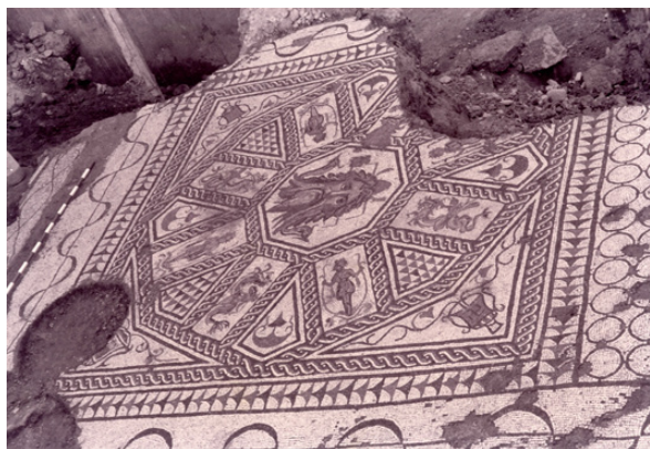
Fig. 1. Mosaico de Océano hallado en Ronda de Tejares 13 (Córdoba).

cia, se inscriben tres círculos concéntricos, delimitando dos anchas bandas en torno al círculo central con la máscara de Océano. En la banda exterior, sobre un fondo marino evocado mediante diferentes especies marinas, destacan cuatro figuras de tritones, tres de ellos centauros marinos, afrontados dos a dos, en actitud heráldica soplando la buccina y portando un pedum o la vara de otro atributo, en la banda intermedia aparecen en cambio florones de plantas acuáticas alternando con delfines afrontados a un tridente, y, por fin, en el círculo central la máscara de Océano, con la fisonomía propia del varón maduro y barbado, con cuatro pares de ante-