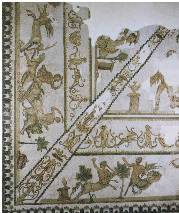
Fig. 6. Fragmento de mosaico de las Termas de Trajano en Acholla. Detalle.

Con la misma tónica, las figurillas de las esquinas en otro mosaico de Estaciones, xe-