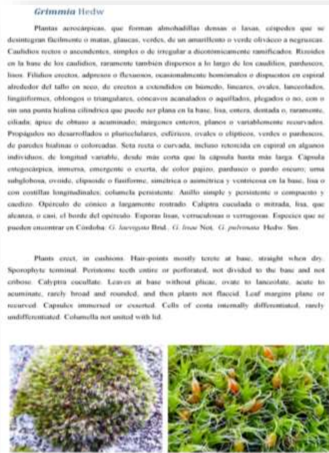
Figura 9. Manual (continuación)

En la guía aparece información de diferentes especies de un total de 12 géneros, 6 de hepáticas y 6 de musgos. Esta guía, así como las claves, se irán actualizando con nuevas especies que se puedan ir encontrando, con el tiempo, en las sucesivas salidas realizadas por la ciudad de Córdoba, en diferentes épocas del año. Estos organismos se pueden observar con mayor facilidad durante la época de lluvias mientras que son difícilmente observables en verano.