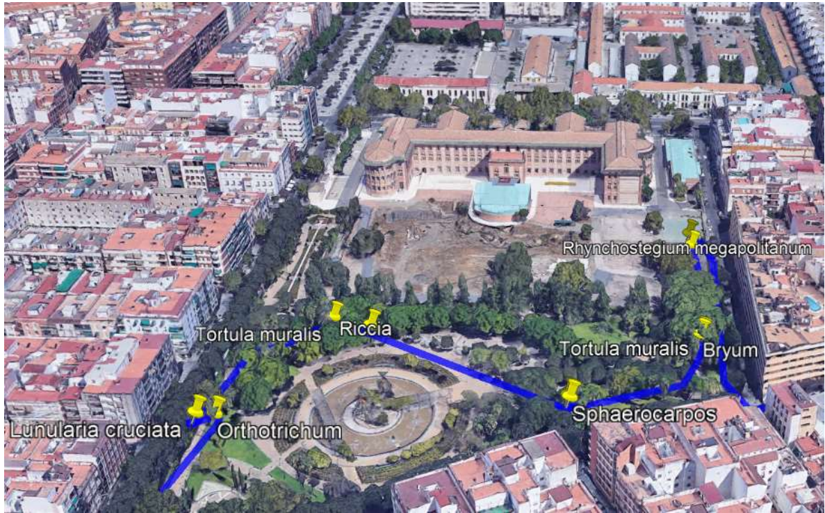
Figura 4. Recorrido realizado Parque Juan Carlos I.