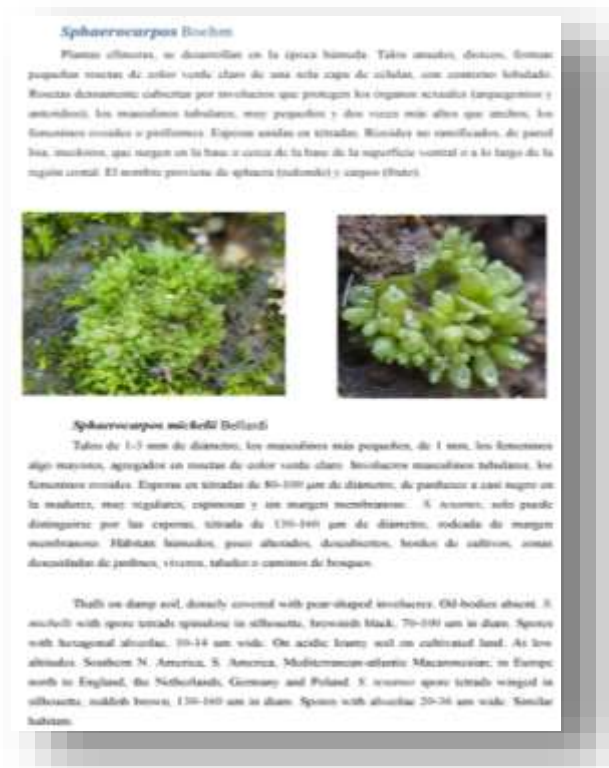
Figura 8. Manual (continuación).