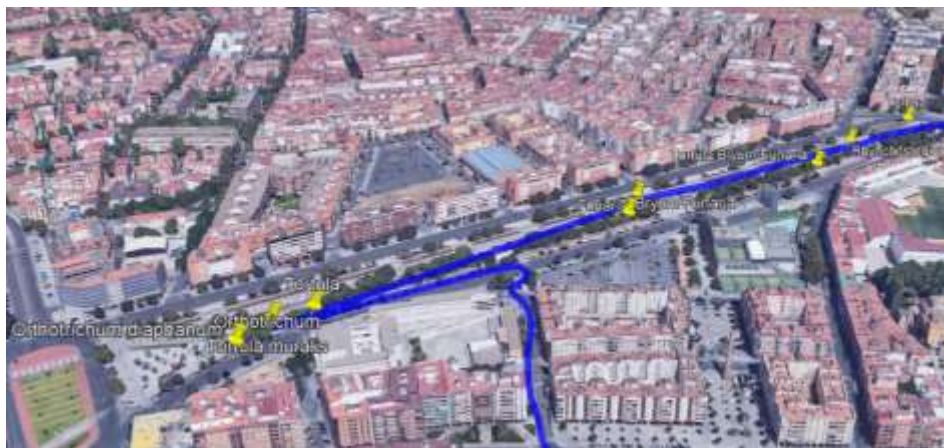
Figura 3. Recorrido realizado Vial Norte.

A continuación aparecen los itinerarios realizados en El Vial Norte, Jardines del Parque Juan Carlos I y Jardines de Colón respectivamente (Figuras 3, 4 y 5).