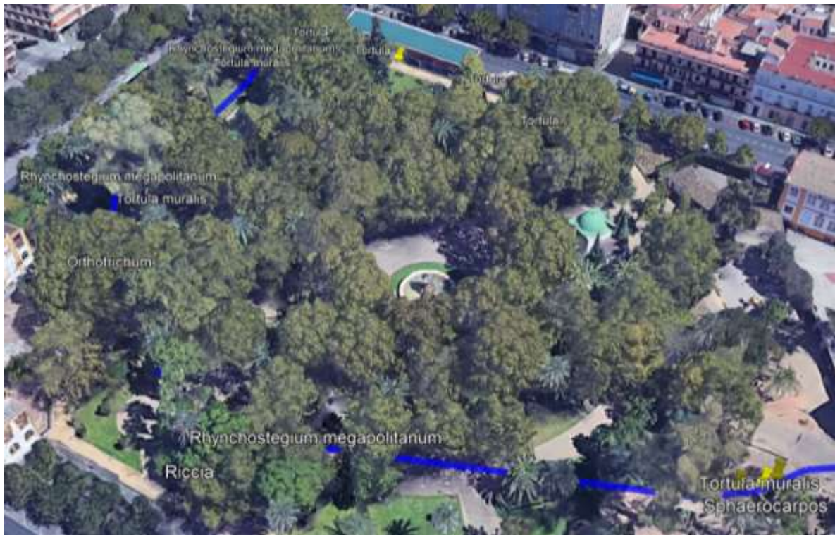
Figura 5. Recorrido realizado Jardines de Colón