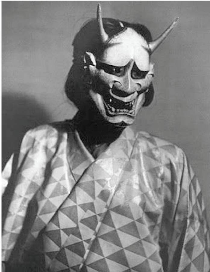
Actor de teatro nô con máscara de Hannya .

cos. Los actores escenificaban la transformación de la mujer en hannya en once fases (según el grado en que iba creciendo el enfado) con sus respectivas máscaras, cada una de gesto más terrible y amedrentador, hasta llegar a la última máscara, en la que el rostro femenino aparecía ya completamente deformado, con los ojos inyectados en sangre, colmillos y cuernos. Un espectacular proceso en el que el aspecto de la mujer iba adquiriendo progresivamente los atributos de un demonio-serpiente [figura 3].