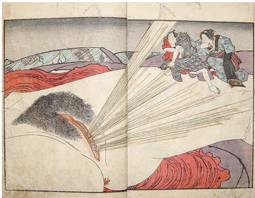
Beanman and Beanwoman Attack on the Vagina, Utagawa Kunisada.