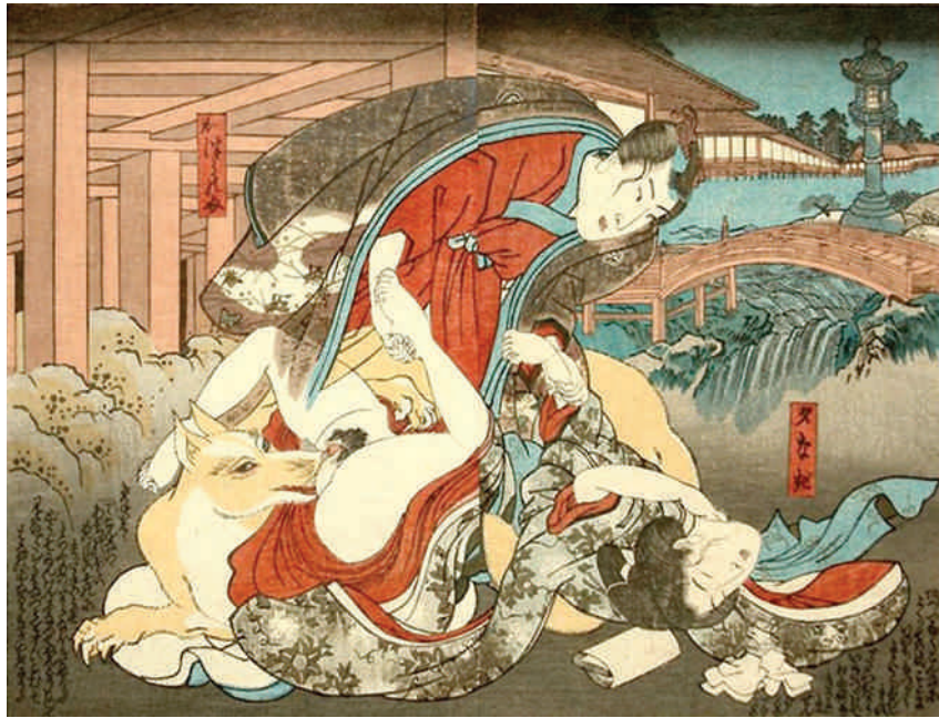
Utagawa Kunisada. Ghost and Fox Spirit making love to a Woman Spirit.