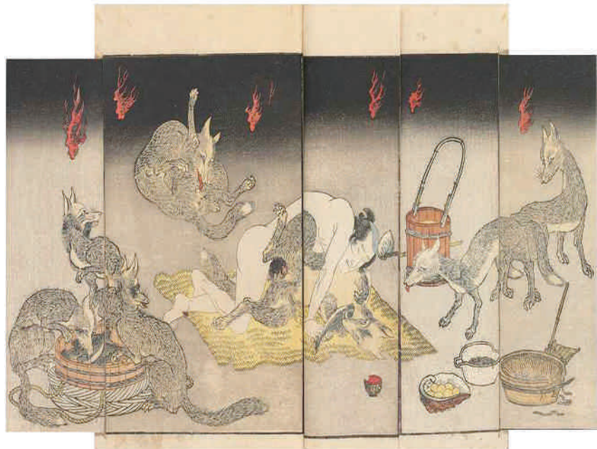
Utagawa Kunisada. Fragmento de Fox Spirit Orgy.