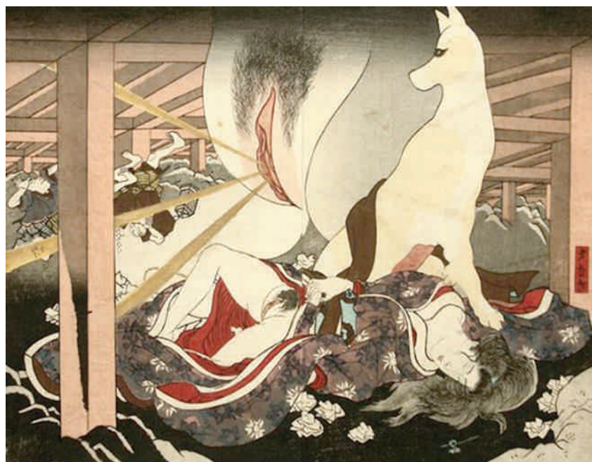
Utagawa Kunisada. Destructive Vagina of the Fox Spirit .

compositivo que en ocasiones llega a solaparse en una suerte de metamorfosis. Véase al respecto Fox Spirit Orgy (1826), obra de mayor envergadura de Kunisada, perteneciente a la serie Tales of Pussy in the Palace at Night [figura 8].