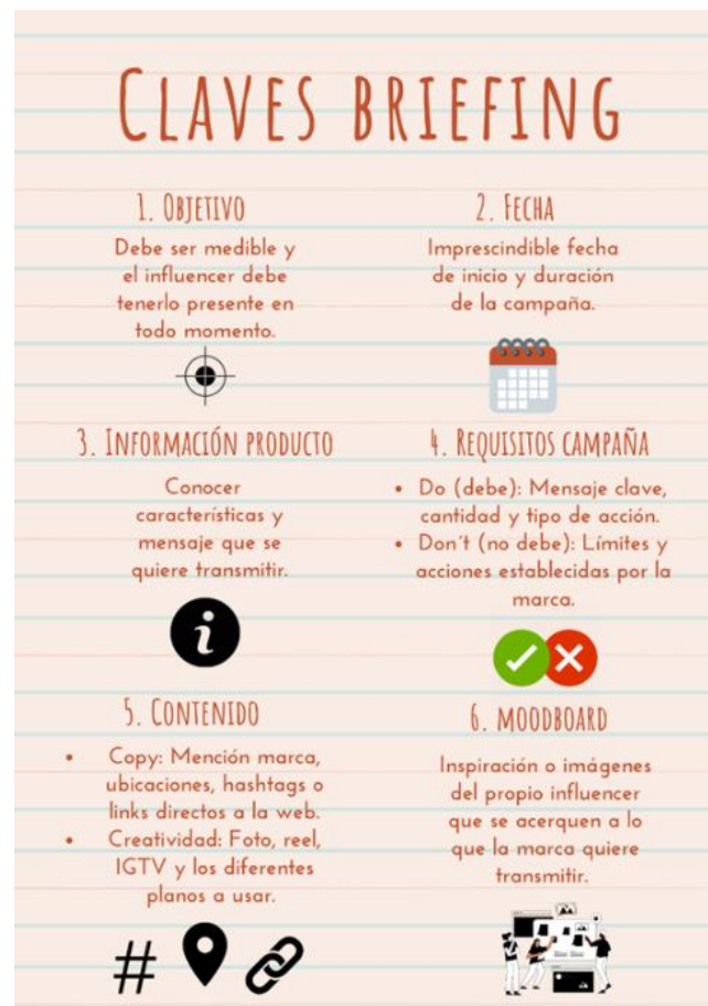
Imagen 3. Esquema de las 6 claves de un briefing