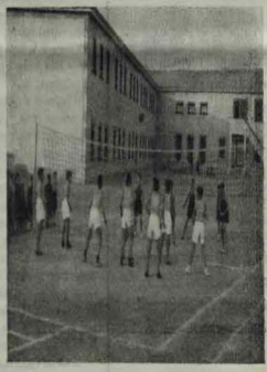
UN MOMENTO DE LOS CAMPAMENTOS DE BAYON DURA DEL CENTRO

10.—Acto de Clausura del Curso (Función religiosa y Solemne Telemisa, Festival gimnástico-deportivo, Acto académico y Clausura oficial del II Curso de Extensión Cultural e Iniciación Técnica).