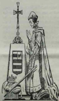
SAN FERNANDO.—PATRON DE LAS JUVENTUDES DE ESPAÑA

Tuvo además tiempo el Santo Rey para fundar Escuelas y Universidades, para publicar varias leyes, organizar la marina y emprender la construcción de las