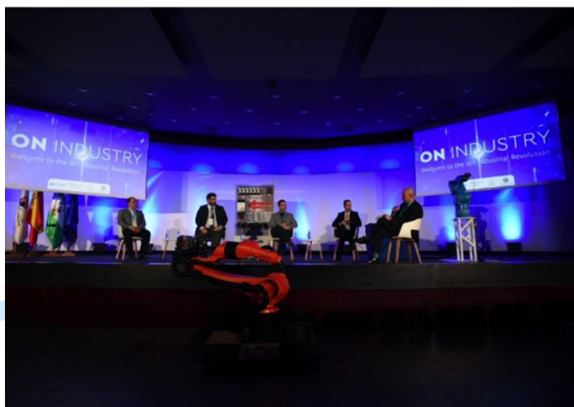
Primera mesa redonda de On Industry