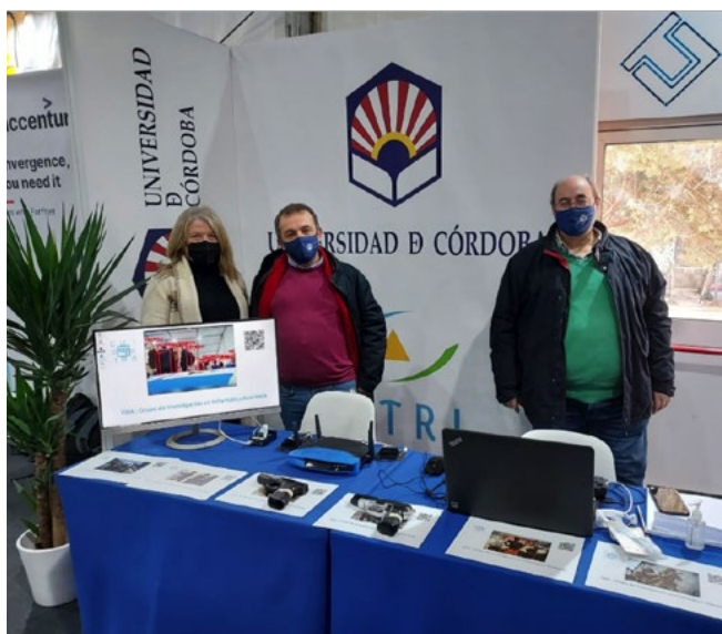
Integrantes de la OTRI en el stand