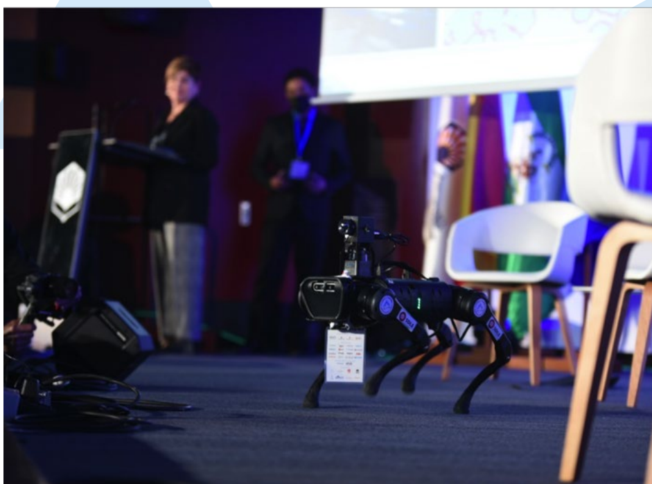
Demostración de un robot durante la inauguración

Adame ha expresado que “estamos pasando de producir en serie a atender las órdenes del cliente, que es el que manda y el que solicita los datos de forma continua”. “En On Industry contamos con partners tecnológicos de los más punteros del mundo, por lo que tenemos aquí el resumen de quiénes mueven la industria en el planeta. En el sur de Europa no hay un evento como este”. El promotor de On Industry ha señalado que este sector genera