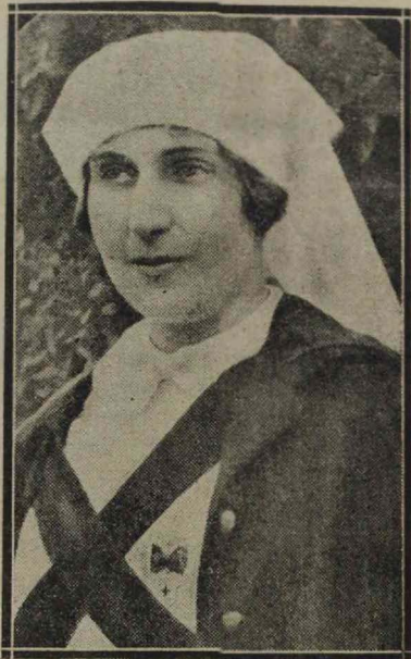
S. M. LA REINA D.ª VICTORIA EUGENIA QUE HA SIDO HUESPED DE CÓRDOBA EL DÍA 13 DEL ACTUAL