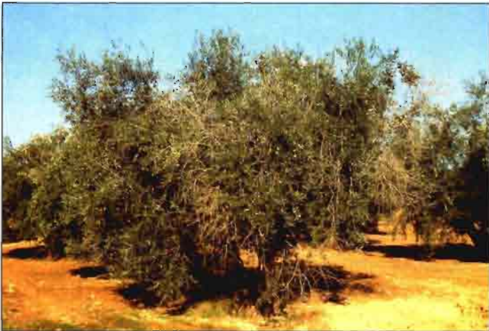
Foto 9. Olivo de la variedad Hojiblanca con intensa defoliación y puntisecado de ramas debidos a la Antracnosis.

moplasma de Olivo de Córdoba resultaron muy susceptibles y la reacción de alguna de ellas, como Empeltre u Hojiblanca, difirió notablemente de los resultados obtenidos por Mateo-Sagasta (1968) en inoculaciones artificiales ( cuadro I ).