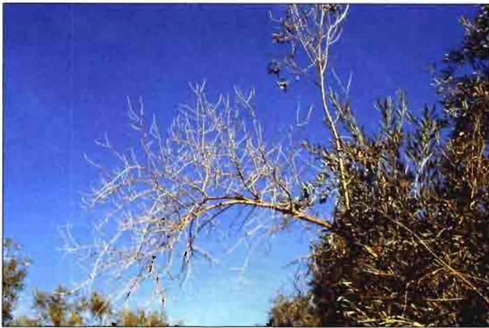
Foto 8. Puntisecado y muerte regresiva de las ramas.