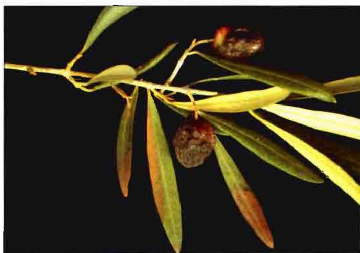
Foto 5. Síntoma inicial de desecación de hojas en un ramo con aceitunas afectadas.

especialización o variabilidad patogénica entre los aislados que causan las aceitunas jabonosas, aunque existen evidencias de que pueda ser elevada. En este sentido, se ha sugerido que la forma que ataca exclusivamente al fruto pueda tratarse de una variante patogénica especializada (Mateo-Sagasta, 1976).