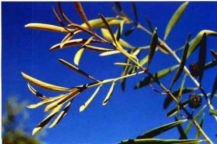
Foto 6. Puntisecado de ramas con aceitunas afectadas.