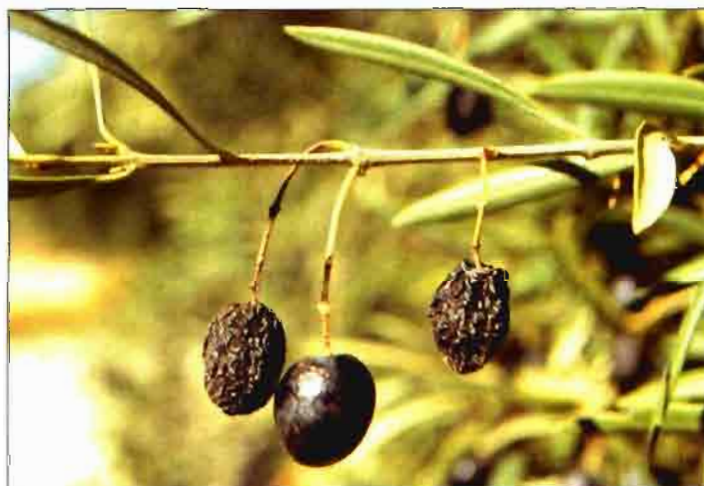
Foto 4. Aceitunas momificadas y detalle de la necrosis del pedúnculo.