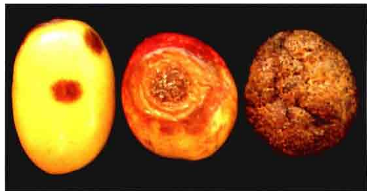
Foto 2. Detalle de la evolución de los síntomas en aceitunas.