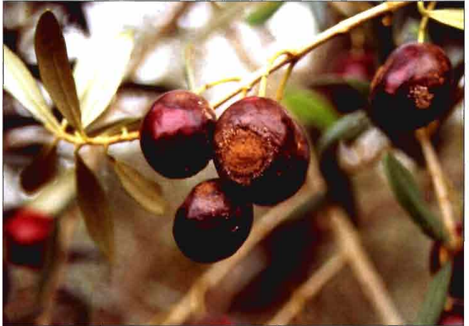
Foto 1. Síntomas iniciales de la podredumbre de aceitunas.

Departamento de Agronomía, ETSIA y Montes, Universidad de Córdoba.