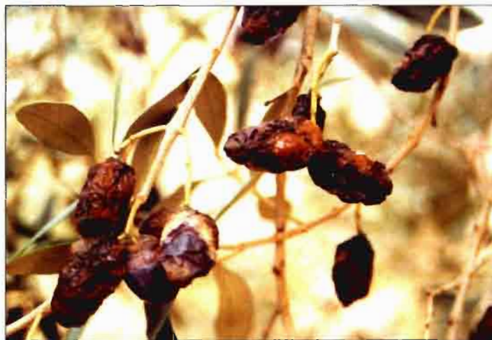
Foto 3. Aceitunas momificadas.

La especie morfológica C. gloeosporioides se considera un grupo genéticamente heterogéneo de hongos, que muestran una elevada variedad fisiológica y patogénica. Aunque se han descrito formas especializadas sobre diversos huéspedes, así como razas geográficas de C. gloeosporioides , no se conoce la