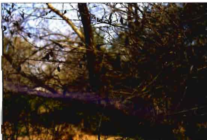
Foto 7. Aceitunas momificadas e intensa defoliación de las ramas.