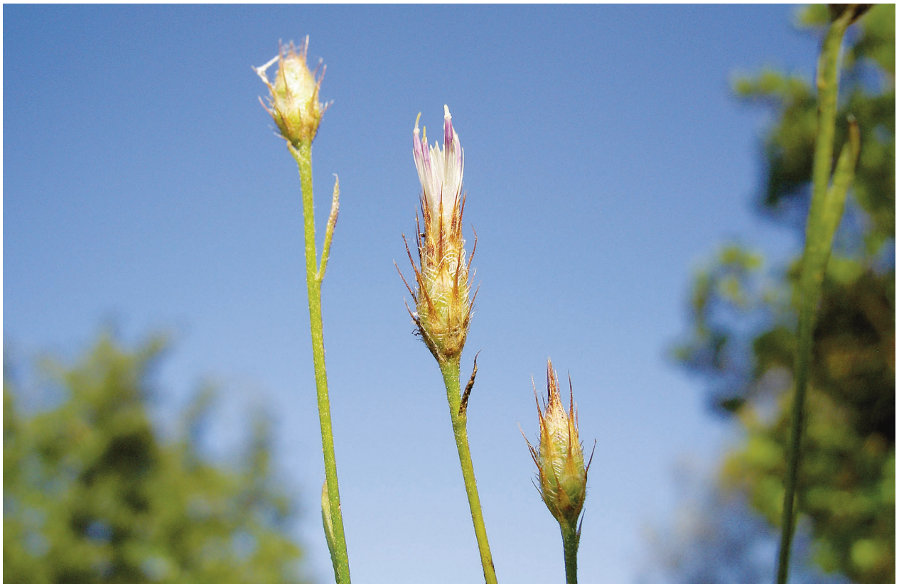
Fig. 4. Centaurea bethurica E. López & Devesa (Baterno, Badajoz).