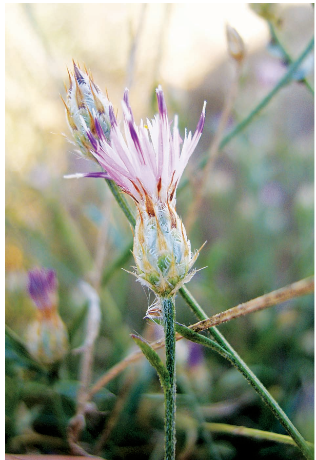
Fig. 5. Centaurea schousboei Lange (Monesterio, Badajoz).

Lectotypus : “ Centaurea/ legi in campis aridis prope/