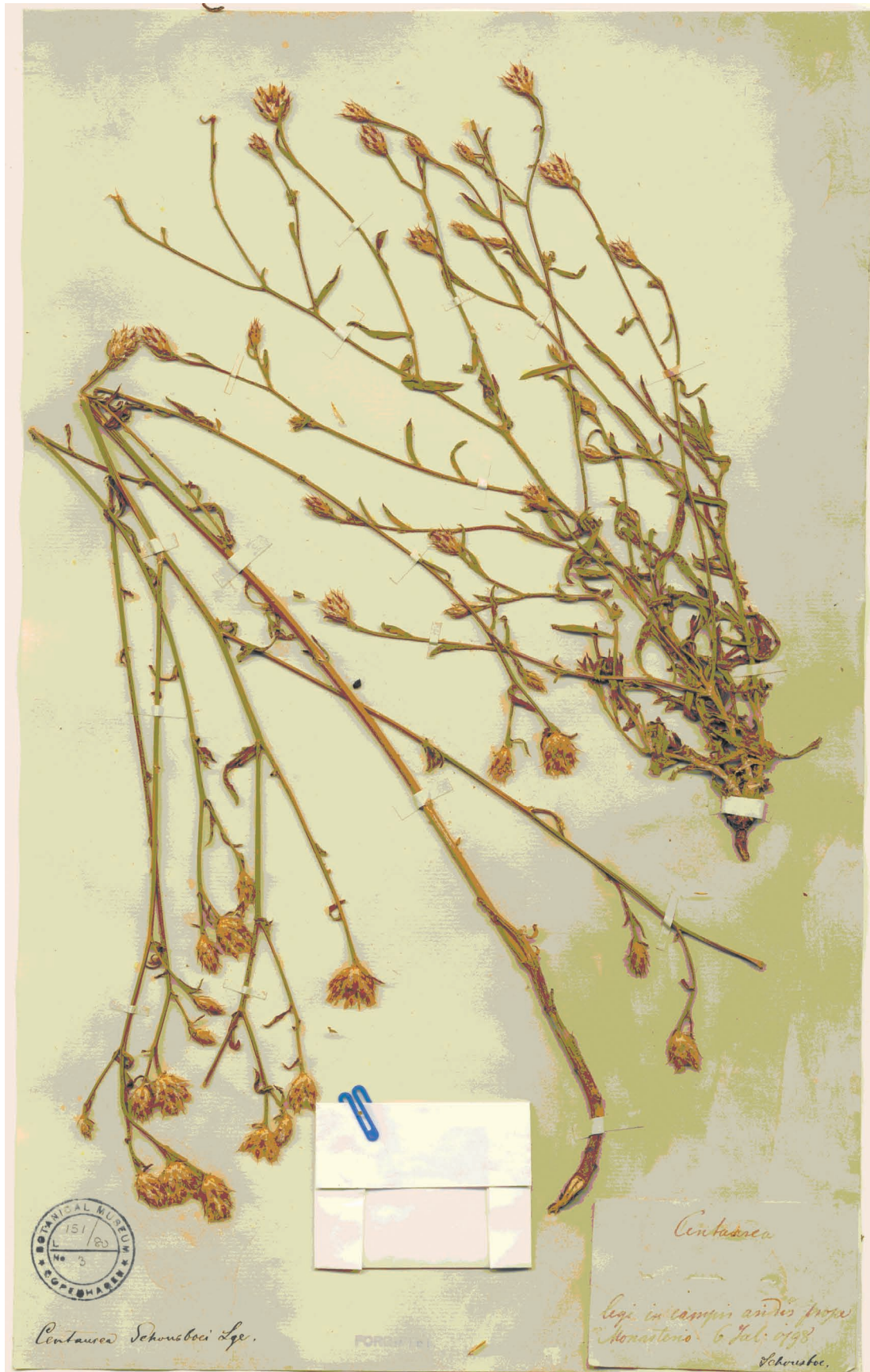
Fig. 6. Lectotypus de Centaurea schousboei (C-Lange s/n).