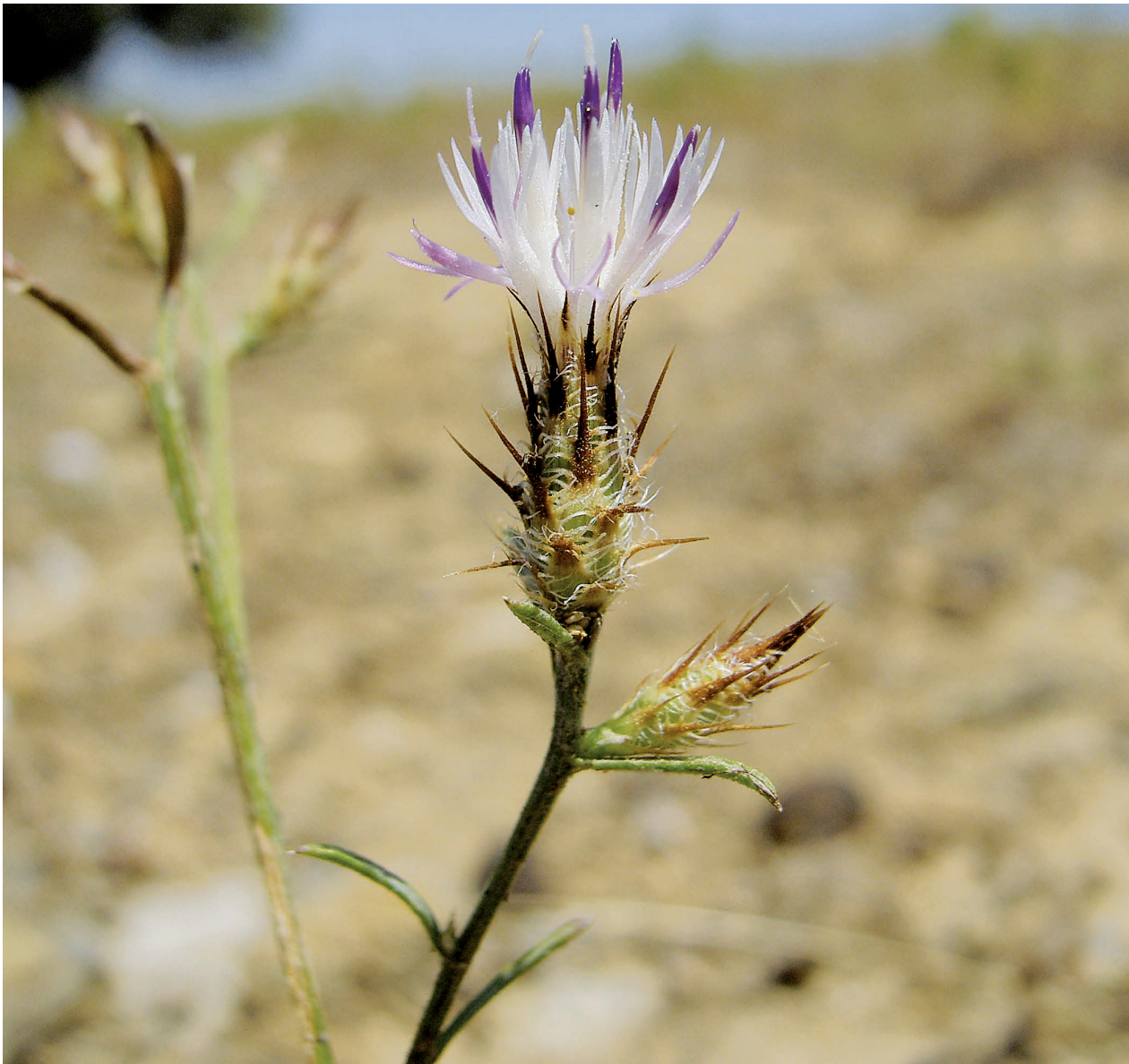
Fig. 2. Centaurea cordubensis Font Quer (bordes del embalse de la Serena, Badajoz).

VII-1997, R. García (MA 596862). Entre El Molinillo y T. Abraham, 6-VII-1977, Velasco (MAF 99691). Mestanza, 24-VI-1995, R. García & al. (SALA 87444). Puerto Lápice, sin fecha, Boissier (G 00074173). Santa Cruz de Mudela, VI-1960, Borja (MA 183474, SALA 598). Villanueva de San Carlos, 30-VI-1995, Barrios & R. García (SALA 87445). Viso del Marqués, Fresneda Alta, 15-VI-1991, Fernández García-Rojo (JAEN 914458); ibidem , Cerro Sotueros, 18-VI-1991, Fernández García-Rojo (JAEN 914493). Córdoba: Bélmez, entre Posadilla y Doña Rama, 1-VII-1981, Varela (COFC 20342). Cerro Muriano, 19-VII-1922, Gros (BC 35335). Fuente Obejuna, 6-VI-1981, F. Fernández & al. (COFC 20344). Puerto de Valderrepiso, VI-1963, Borja (MAF 100923). Río Guadiato, 10-VI-1980, Díaz & al. (SEV 70364). Santa María de Trasierra, 15-VII-1981, Varela (COFC 20345, SALA 66342, SEV 70363). Sierra Morena, cuenca del Guadalupe, V-1920, Pau (BC 34755, MA 135206). Villaharta, 16-VI-1982, Fernández & al. (SEV 208946). Huelva: El Marquesado, 14-VI-2006, Devesa & al. (UNEX 35206). Puerto de la Laja, El Granada, 14-VI-2001, Sán-