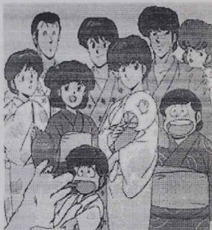
5. La puesta en común proporciona validez externa a nuestro trabajo.

Los temas que estas maestras consideran más adecuados para sus alumnos/as no distan mucho de lo que los propios alumnos/as han elegido: Educación en valores y Temas Transversales y las relaciones humanas (compañerismo, amor, cariño, etc.)