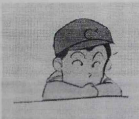
3. las cuestiones deben adaptarse a la edad para no aburrir a los niños/as.

Las técnicas usadas para esta investigación han sido dos cuestionarios, uno para los alumnos/as y otro para las maestras. El cuestionario de los alumnos/as está compuesto por diez cuestiones de los cuales ocho son cerradas y dos son abiertas, por haber considerado las preguntas cerradas más fácil de contestar por estos niños/as. El cuestionario que realizamos para pasarlo a las maestras está compuesto por seis cuestiones de las cuales cuatro son abiertas y dos cerradas pues nos interesaba tener una extensa y variada información con un carácter más cualitativo.