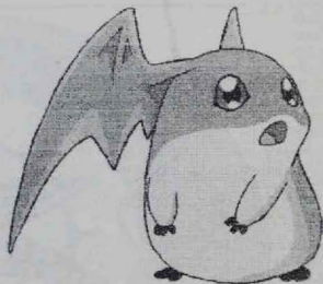
1. Los niños/as pasan casi el mismo tiempo viendo la televisión que en el colegio.

Una vez diseñadas las técnicas de recogida de datos, las pasamos a los alumnos/as de dos grupos mixtos entre 6 y 8 años (1º y 2º de Primaria). Con la información que obtuvimos elaboramos una serie de tablas y gráficos con el objeto de facilitar su análisis y obtener una visión clara de las diferencias que queríamos señalar y que vagamente preveíamos. Finalmente elaboramos un informe en el que presentábamos nuestras conclusiones que, en buena medida, daban respuesta a las preguntas planteadas al principio.