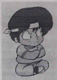
4. Si las cuestiones son demasiado difíciles frustrarán a los niños/as.