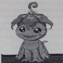
2. Gran parte de la educación de nuestros hijos depende de la programación televisiva.

El método que vamos a utilizar para llevar a cabo nuestra investigación es descriptivo y se concreta en un diseño determinado que será un estudio de campo. En este sentido, trabajaremos en situaciones de contexto natural.