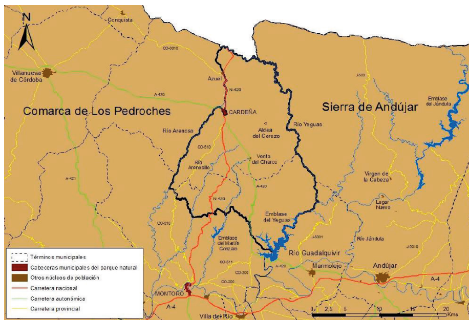
Figura 1: Mapa del Parque Natural Sierra Cardena y Montoro con sus referencias territoriales básicas.

Para esta investigación se ha tenido en cuenta el contexto territorial del Parque Natural Sierra de Cardena y Montoro, y cuenta con una extensión de 38.449 hectáreas, repartidas entre los municipios que dan nombre al propio espacio protegido: Cardena (aglutinando 23.069 hectáreas, alrededor del 60% de la superficie del Parque) y Montoro (que por su parte aporta unas 15.380 hectáreas, suponiendo el 40% restante del espacio protegido). Se trata de un parque de tamaño medio, si se tiene en cuenta el contexto tanto de Sierra Morena como de la RENPA (Red de Espacios Naturales Protegidos de Andalucía). Este parque se encuentra ubicado en el cuadrante más nororiental de la Sierra Morena; al sur linda con los amplios espacios de olivar extendidos por la porción más septentrional del término municipal de Montoro, al este limita con la provincia de Jaén (concretamente, con el Parque Natural Sierra de Andújar, actuando el río Yeguas como límite natural), mientras que por el norte linda con la provincia de Ciudad Real. Por otro lado, limita al oeste con el río Arenoso y los extensos espacios montanos del sector central del espacio mariánico cordobés, limitando a su vez al noroeste con el batolito granítico tan característico de la zona de los Pedroches (véase en la figura 1).