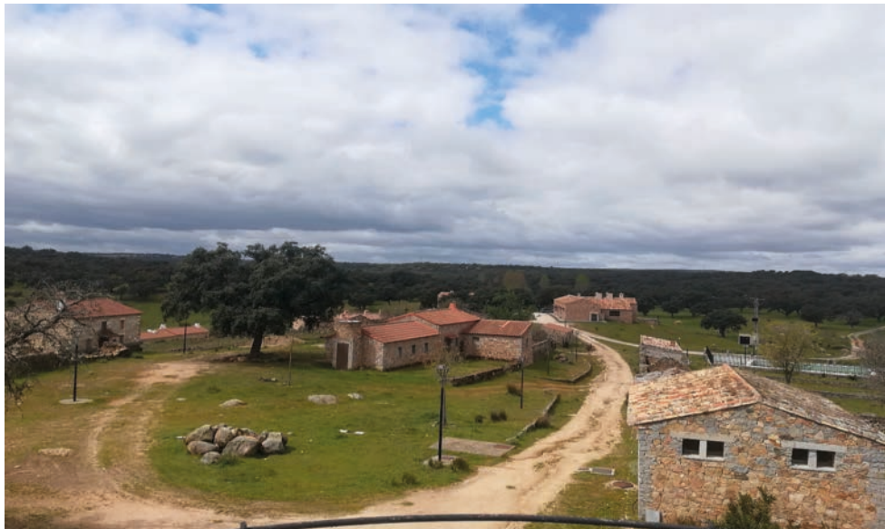
Figura 4: Panorámica de la Aldea del Cerezo desde el mirador en el municipio de Cardeña, dentro de los límites del Parque Natural Sierra de Cardeña y Montoro, hoy día en estado de casi abandono.