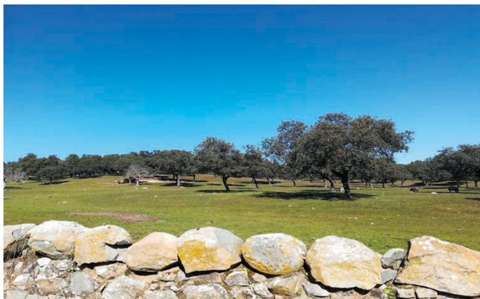
Figura 2: Paisaje adeshado y cerco de granito (característico material tradicional y endógeno) en el sector de los Pedroches dentro del Parque Natural Sierra de Cardeña y Montoro.