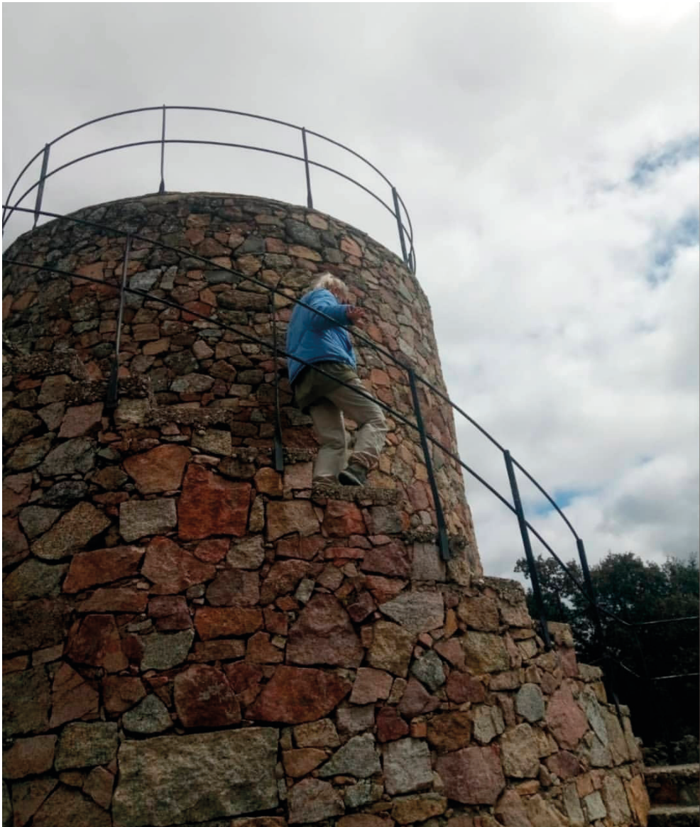
Figura 5: Mirador de granito batolítico en Aldea del Cerezo, situado en Cardena, zona de Los Pedroches, dentro de los límites del Parque Natural Sierra de Cardena y Montoro.