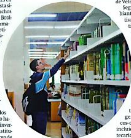
Arriba, una alumna aprovecha los puestos de lectura y estudio de la Biblioteca Maimónides. Abajo, un estudiante busca un libro entre los fondos bibliográficos.

Por otro lado, hoy día, destaca la Biblioteca Digital, que posibilita el acceso a todo tipo de recursos documentales, las herramientas de apoyo al aprendizaje y los canales de comunicación abiertos permanentemente gracias a las redes sociales. Las adquisiciones bibliográficas se realizan con fondos procedentes de la propia universidad (biblioteca, decanatos, departamentos, grupos de investigación), del Consorcio de Bibliotecas Universitarias de Andalucía y mediante financiación externa (Fundación Española de Ciencia y Tecnología).