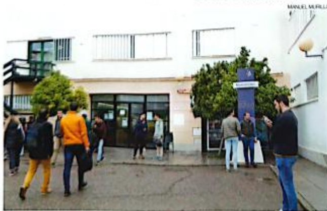
La entrada principal de la Biblioteca Maimónides de la UCO. Des del servicio central de entrada y salida de alumnos.

Pero hasta llegar a este alto punto de utilidad y modernidad, el proceso ha sido largo y ha estado repleto de esfuerzos que hay que reconocer. En esa línea, como primer reconocimiento, hay que decir que la Facultad de Veterinaria contó desde el inicio de su andadura, como Escuela en la calle Encarnación Agustina, con biblioteca. Este servicio se mantuvo siempre, aunque con superficies insuficientes, pasando sucesivamente al edificio principal de Medina Azahara y, por último, a un edificio de nueva planta instalado en los jardines de la entonces Facultad (donde actualmente se encuentra la cafetería del Rectorado).