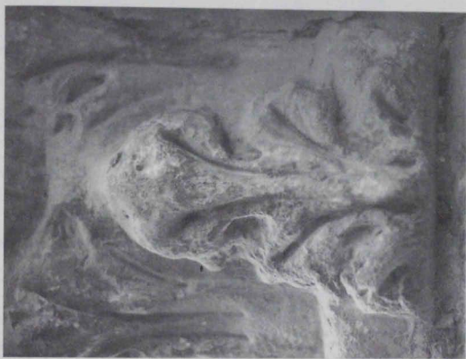
Lámina 4: Capitel núm. 1.