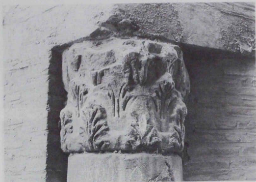
Lámina 5: Capitel núm. 1.