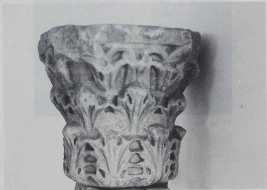
Lámina 3: Capitel núm. 4.