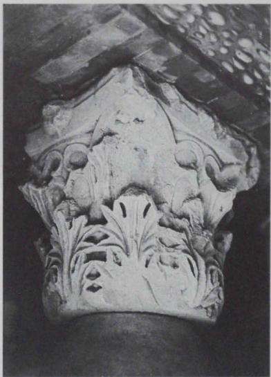
Lámina 1: Capitel núm. 2.