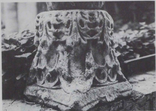
Lámina 2: Capitel núm. 3.